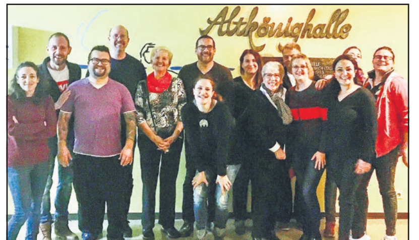
FDP Steinbach mit Freunden bei den Stadtmeisterschaften im Luftgewehrschießen