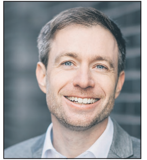
Bürgermeister Steffen Bonk