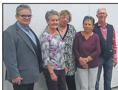
neuer Vorstand Steinbach JHV 25.11.2019