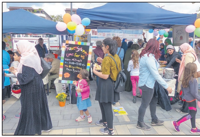
Feiern auf der Untergasse in 2018

noch lange hin! Derzeit genießen wir die hellen Tage. Auszugsweise nun ein paar Infos aus der Sozialen Stadt. Seien Sie herzlich zu den Angeboten eingeladen. Die Akteurinnen und Akteure freuen sich auf Ihr Kommen, Mitmachen und Dabeisein! Die Frauengruppe „time for us“, die die Frauenfeste ins Leben rief, trifft sich nach den Sommerferien wieder mittwochs von 9-11 Uhr im Raum Pijnacker im Bürgerhaus und freut sich auf weitere Frauen jeden Alters und aller Kulturen, um sich bei gemeinsamem Frühstück auszutauschen. Die „Näherwerkstatt“ findet sich freitags von 15-17 Uhr im Stadtteilbüro zusammen: Nähen, Häkeln, Stricken, Basteln... Kreativität und Miteinander leben, kultur-, sprach- und altersunabhängig ist deren Motto. Die AG „Steinbach blüht“ trifft sich in den ungeraden Wochen immer mittwochs um 18 Uhr (der nächste Termin ist der 28.8.) auf dem Schulvorplatz der Geschwister-Scholl-Schule zum gemeinsamen Gärtnern an den Beeten, die die AG angelegt hat. In den geraden Wochen lädt der „Mittagstisch“ montags (die nächsten Termine