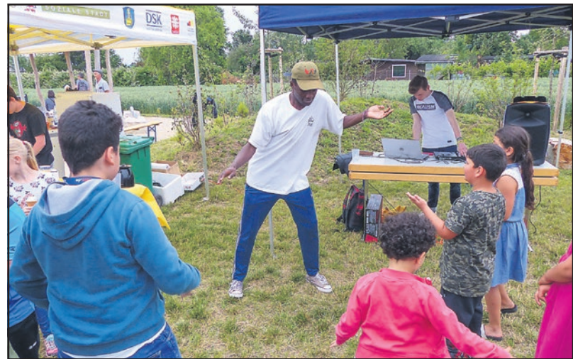
Tanzen und Einweihung feiern mit Cypher 449

Kontakt: Bärbel Andresen Quartiersmanagement Wiesenstraße 6 Telefon: (0 61 71) 2 07 84 40 E-Mail: andresen@caritas-hochtaunus.de