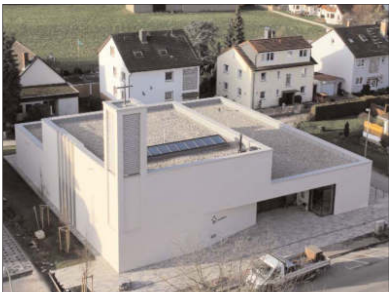
Kath. Pfarrei St. Ursula Oberursel / Steinbach

Katholische St. Bonifatiusgemeinde Untergasse 27 - 61449 Steinbach