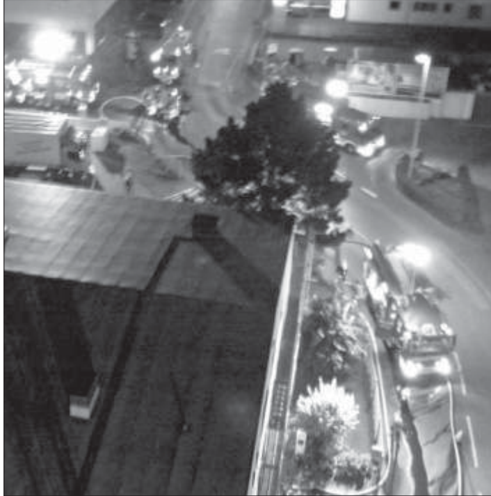
Am Freitag, 14. Sept. probte die Freiwillige Feuerwehr, bei der Firma Reichard-Verpackungen, den Ernstfall.