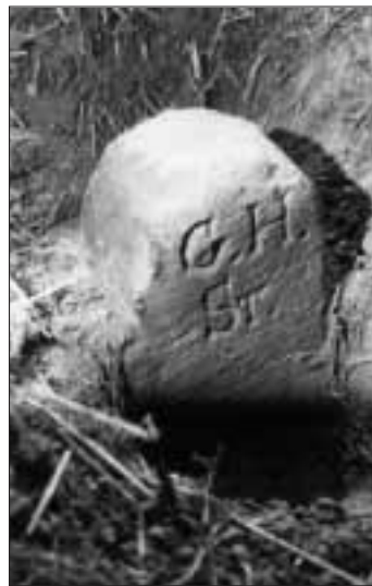
So gefunden 1989 . . .