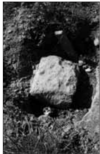
... und so sieht er heute 2011 aus!