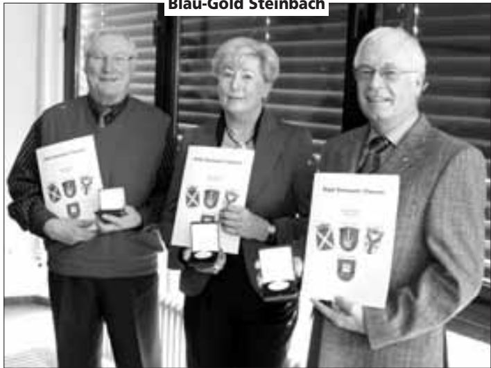
TuS Steinbach 1885 e.V.