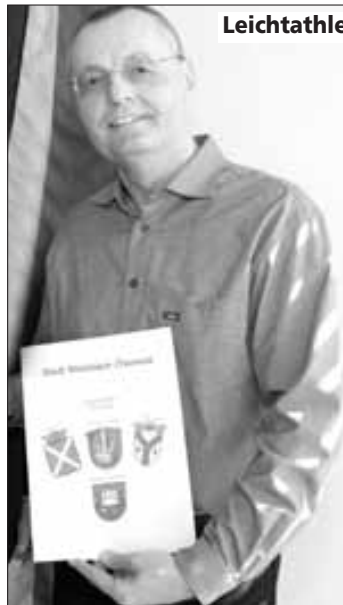
Leichtathletik Club Steinbach