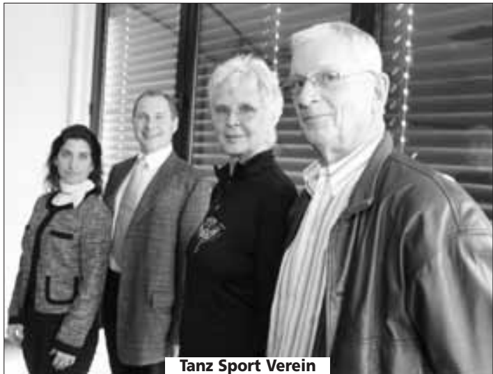
Tanz Sport Verein Blau-Gold Steinbach