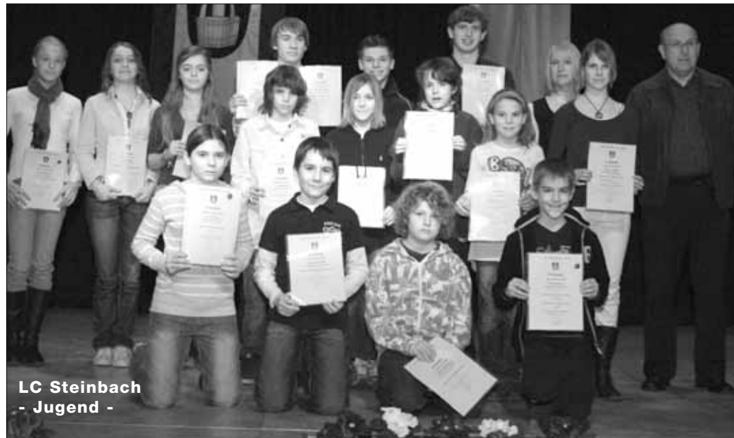
LC Steinbach - Jugend -