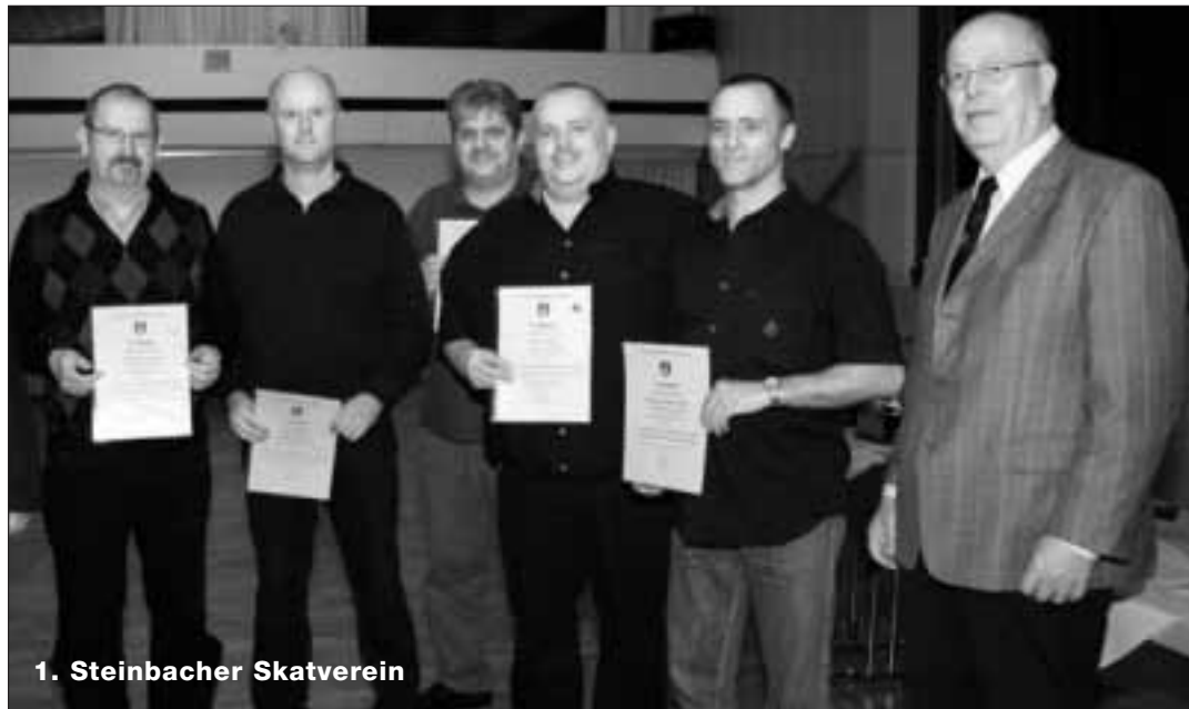
1. Steinbacher Skatverein