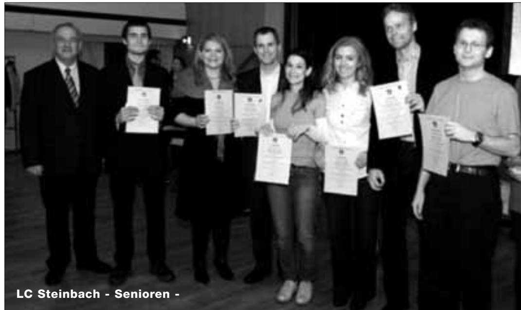
LC Steinbach - Senioren -

STEMPEL BOBBI Bahnstraße 3 · Telefon: 981 983