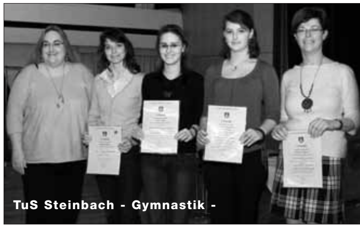
TuS Steinbach - Gymnastik -