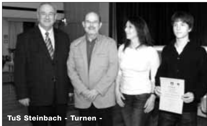
TuS Steinbach - Turnen -