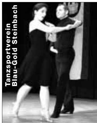
Tanzsportverein Blau-Gold Steinbach