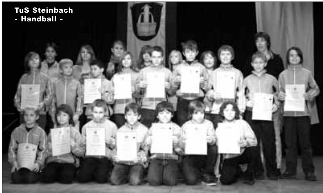
TuS Steinbach - Handball -