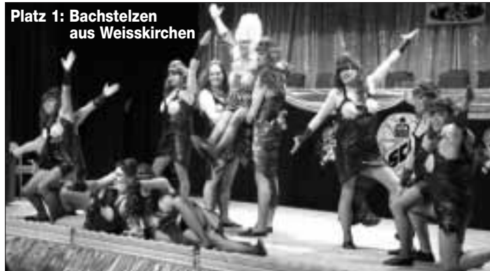
Platz 1: Bachstelzen aus Weisskirchen