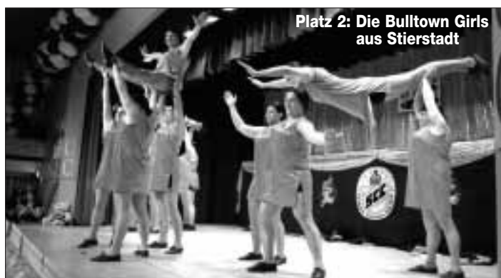
Platz 2: Die Bulltown Girls aus Stierstadt