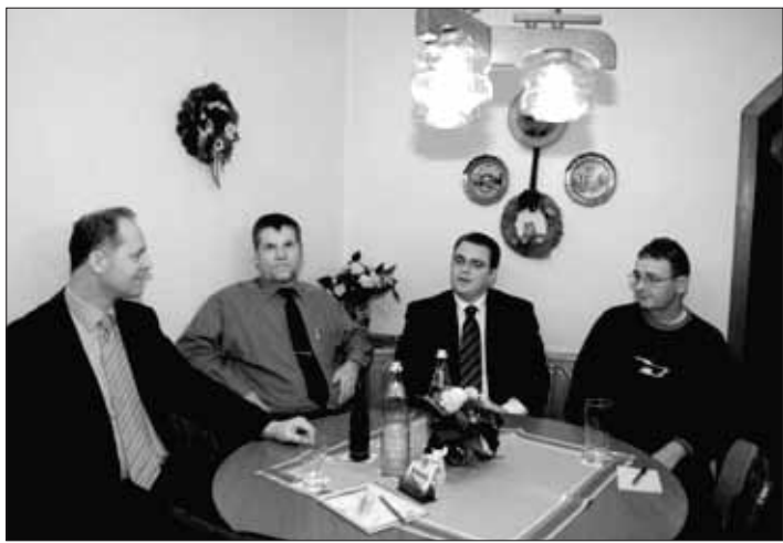
3 Fotos: Dieter Nebhuth