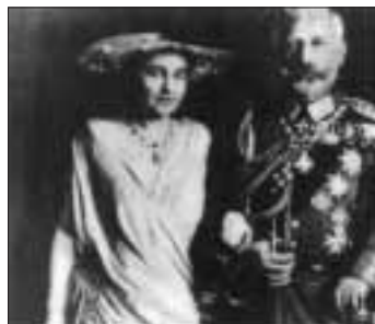
Wilhelm II., mit Hermine