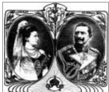
Wilhelm II., mit Auguste Viktoria