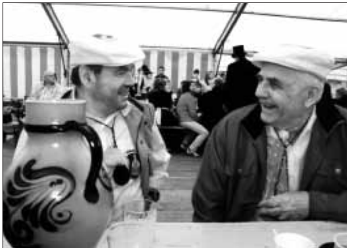
Willi saach emal, ich hab geheert du willst auswandern, stimmt des? Ja, Fritz, daa is was draa! Weit wegg will ich. Abber zuerst gehts emal über de Sandplakke, un dann seen mer weiter!