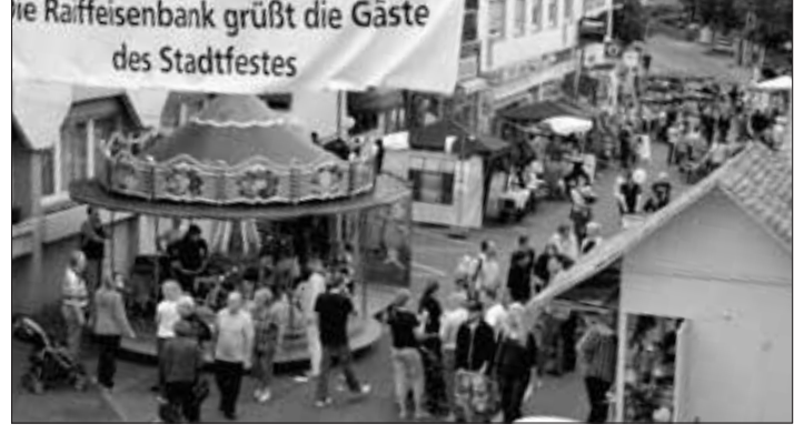
Die Raiffeisenbank grüßt die Gäste des Stadtfestes