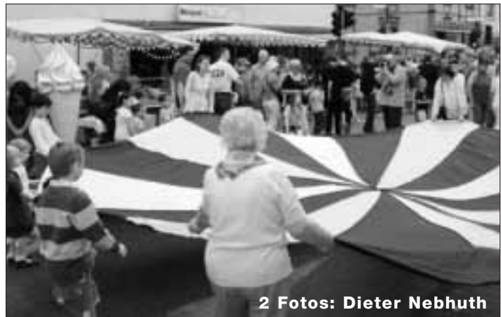
2 Fotos: Dieter Nebhuth

Die TuS Steinbach präsentierte sich auf dem 5. Steinbacher Stadtfest am 24. und 25. Mai 2008 mit einem Informationsstand auf der Bahnstraße. Interessierte Besucher erhielten Informationen über das Angebot des Vereins und konnten die neue Vereinsbroschüre mitnehmen. Diese Broschüre, in der sich alle Abteilungen und Sparten vorstellen, liegt auch in der Friedrich-Hill-Halle für alle bereit. Am Sonntag Nachmittag zeigte die Abteilung Kinderturnen Übungen aus ihrem Programm ohne und mit Fallschirm. Im Anschluss führten die Line-Dancer der TuS vor, was im vergnüglichen sonntäglichen Line Dance geübt wurde und luden alle Zuschauer ein, beim Line Dance mitzumachen.