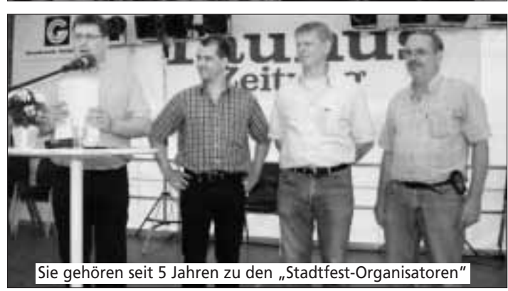
Sie gehören seit 5 Jahren zu den „Stadtfest-Organisatoren“