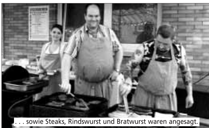
... sowie Steaks, Rindwurst und Bratwurst waren angesagt.