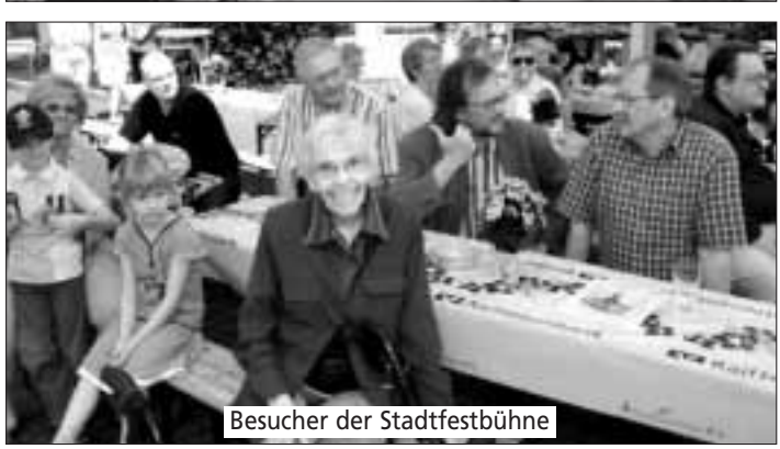
Besucher der Stadtfestbühne