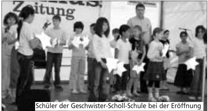
Schüler der Geschwister-Scholl-Schule bei der Eröffnung