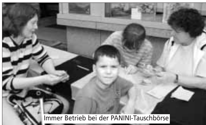
Immer Betrieb bei der PANINI-Tauschbörse