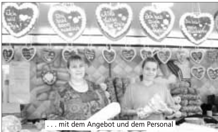
... mit dem Angebot und dem Personal