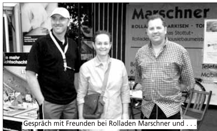
Gespräch mit Freunden bei Rolläden Marschner und ...