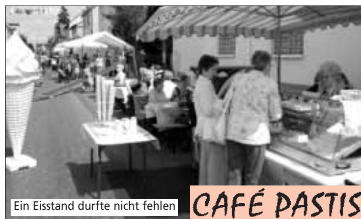
Ein Eisstand durfte nicht fehlen