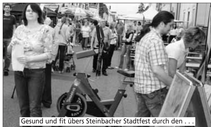
Gesund und fit übers Steinbacher Stadtfest durch den ...