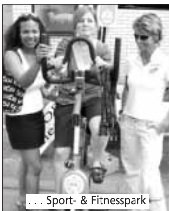
... Sport- & Fitnesspark