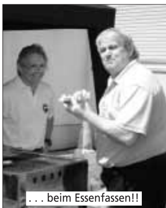
... beim Essenfassen!!