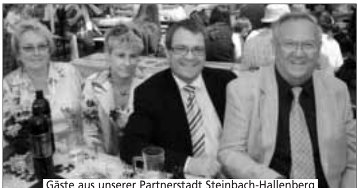
Gäste aus unserer Partnerstadt Steinbach-Hallenberg