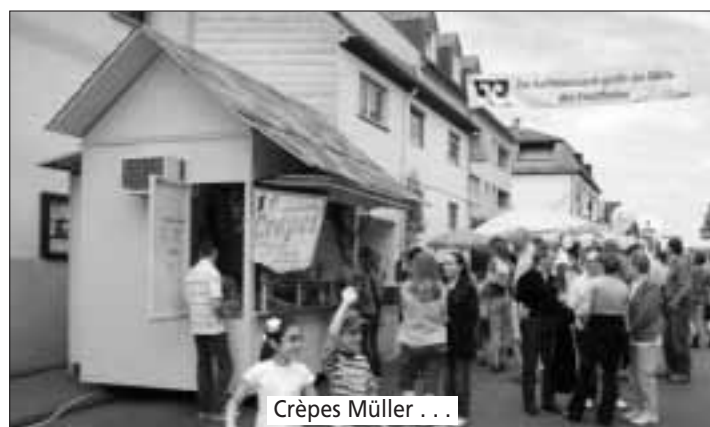
Crêpes Müller ...

STEMPEL BOBBI Bahnstraße 3 · Telefon: 981 983