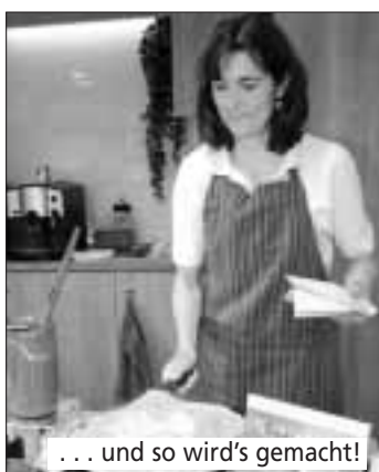
... und so wird's gemacht!