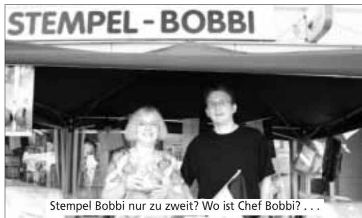
Stempel Bobbi nur zu zweit? Wo ist Chef Bobbi? ...