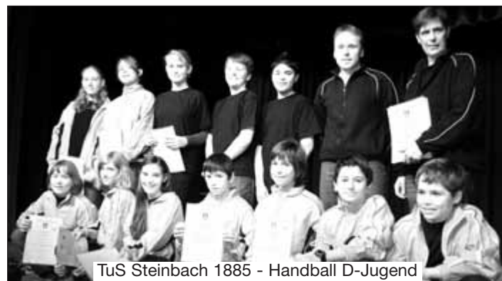
TuS Steinbach 1885 - Handball D-Jugend