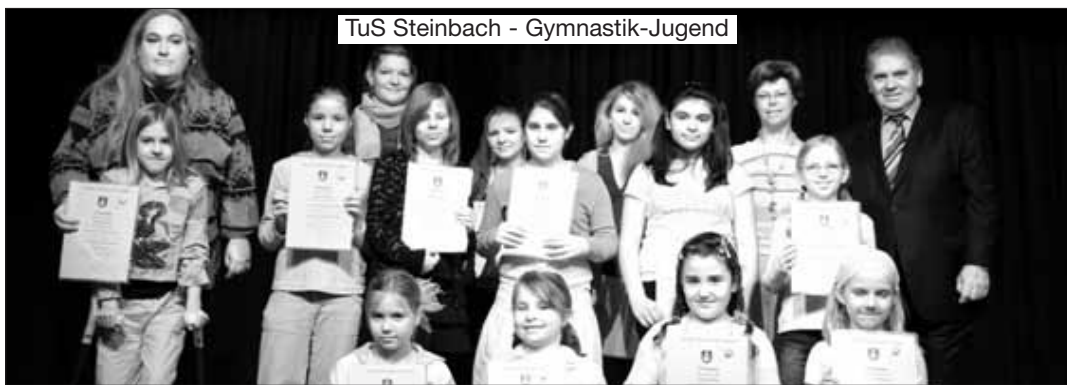
TuS Steinbach - Gymnastik-Jugend