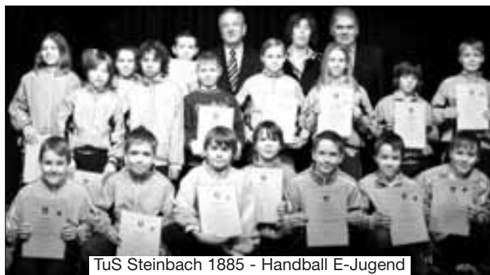
TuS Steinbach 1885 - Handball E-Jugend