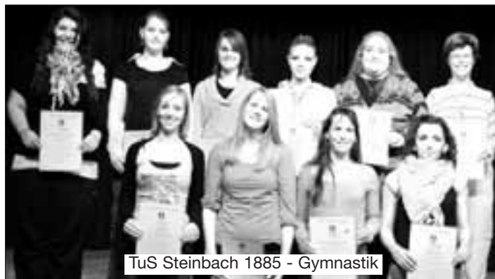
TuS Steinbach 1885 - Gymnastik