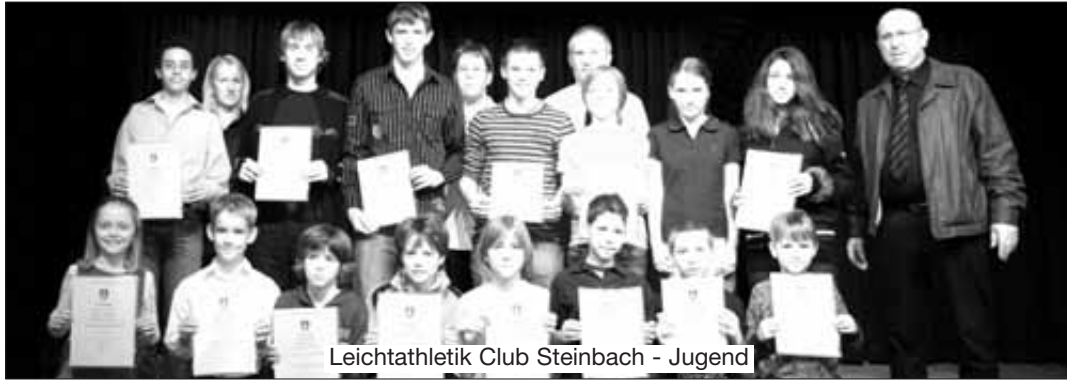
Leichtathletik Club Steinbach - Jugend