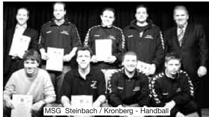
MSG Steinbach / Kronberg - Handball