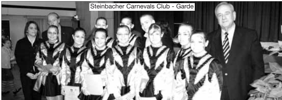
Steinbacher Carnivals Club - Garde