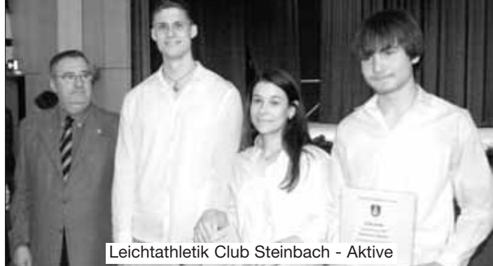
Leichtathletik Club Steinbach - Aktive