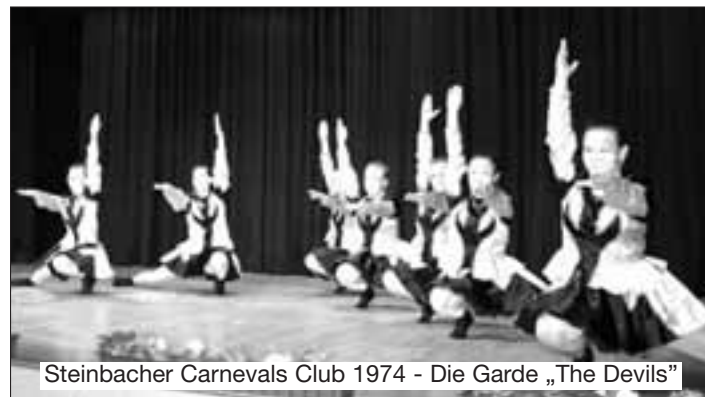
Steinbacher Carnevals Club 1974 - Die Garde „The Devils“