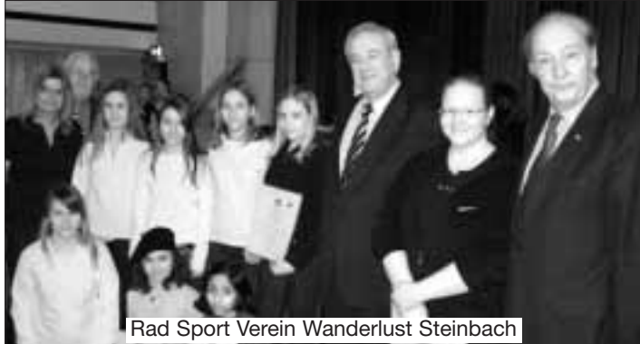
Rad Sport Verein Wanderlust Steinbach