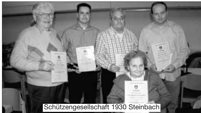
Schützengesellschaft 1930 Steinbach