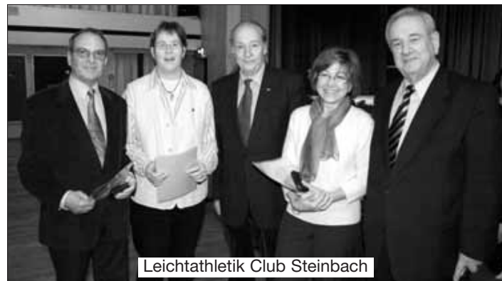
Leichtathletik Club Steinbach