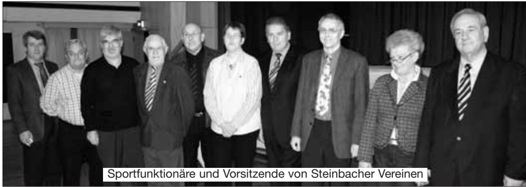
Sportfunktionäre und Vorsitzende von Steinbacher Vereinen