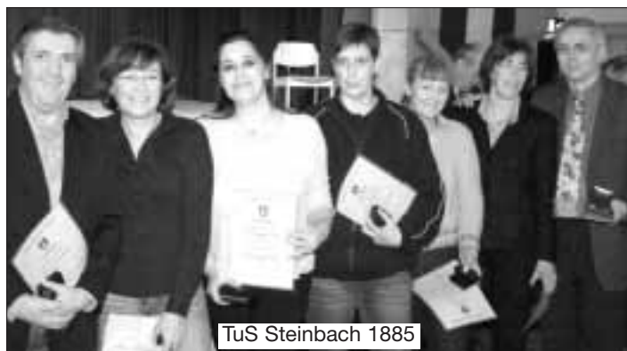
TuS Steinbach 1885