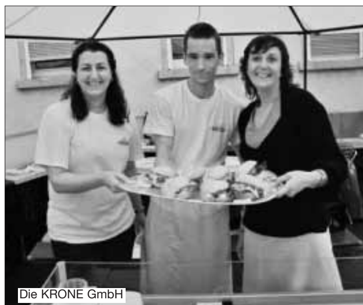
Die KRONE GmbH