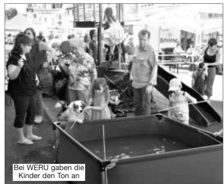
Bei WERU gaben die Kinder den Ton an