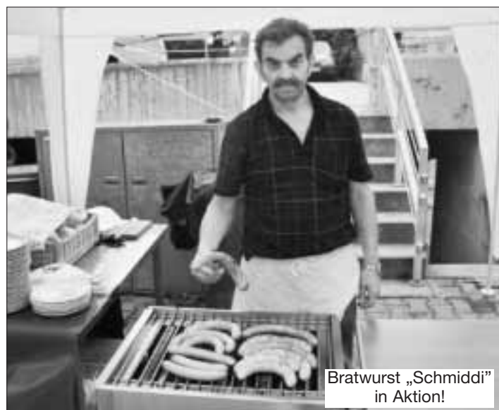
Bratwurst „Schmidli“ in Aktion!