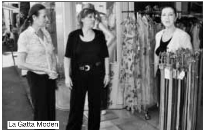
La Gatta Moden