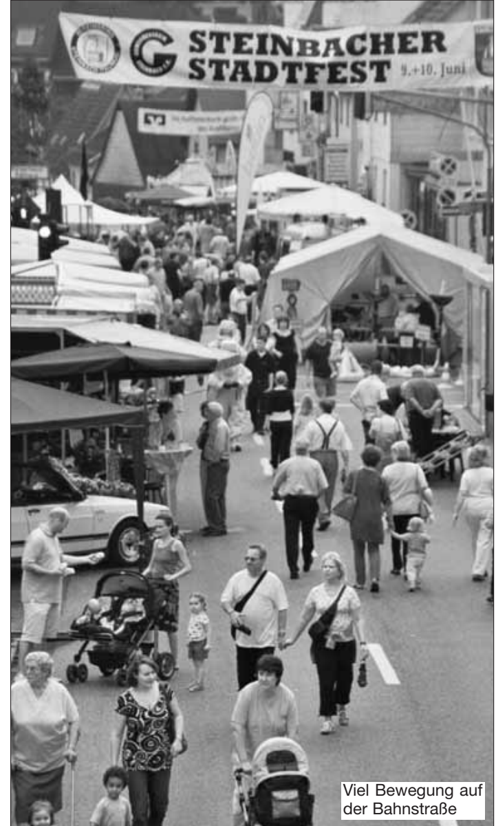
Viel Bewegung auf der Bahnstraße