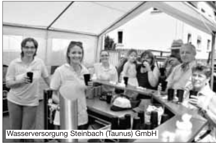
Wasserversorgung Steinbach (Taunus) GmbH

Weitere Infos: Stadtbücherei Steinbach (Taunus), Tel. (0 61 71) 98 01 67.