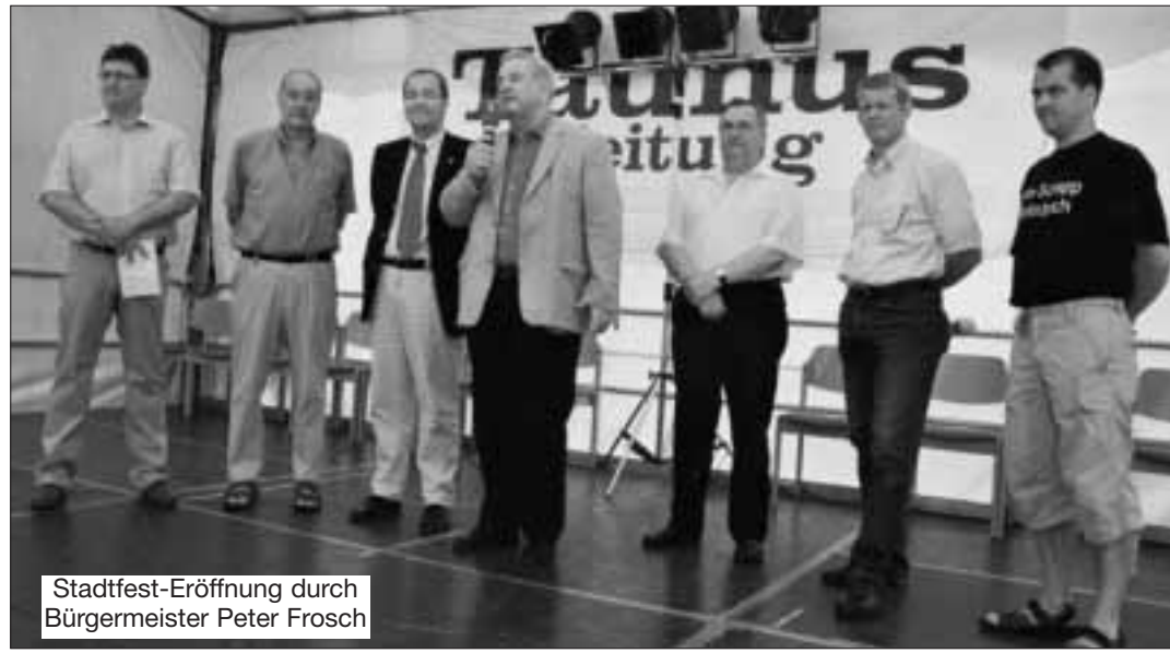
Stadtfest-Eröffnung durch Bürgermeister Peter Froesch