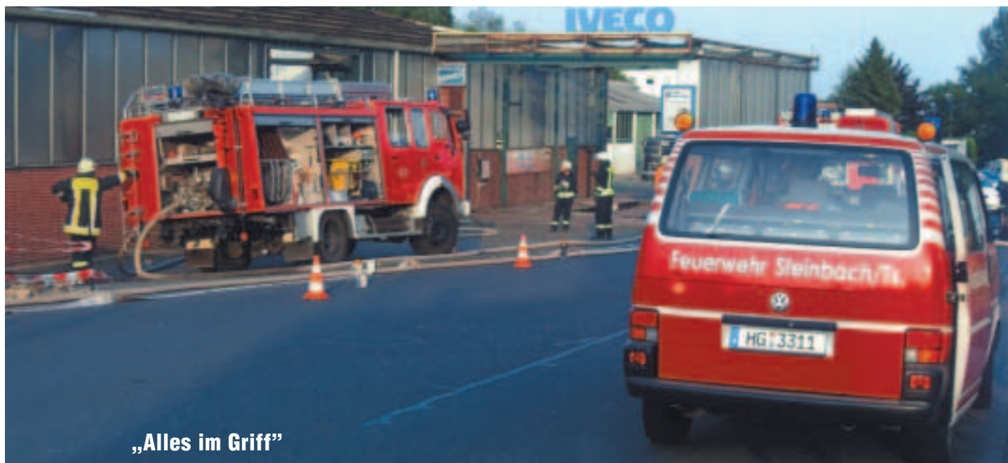
„Alles im Griff“