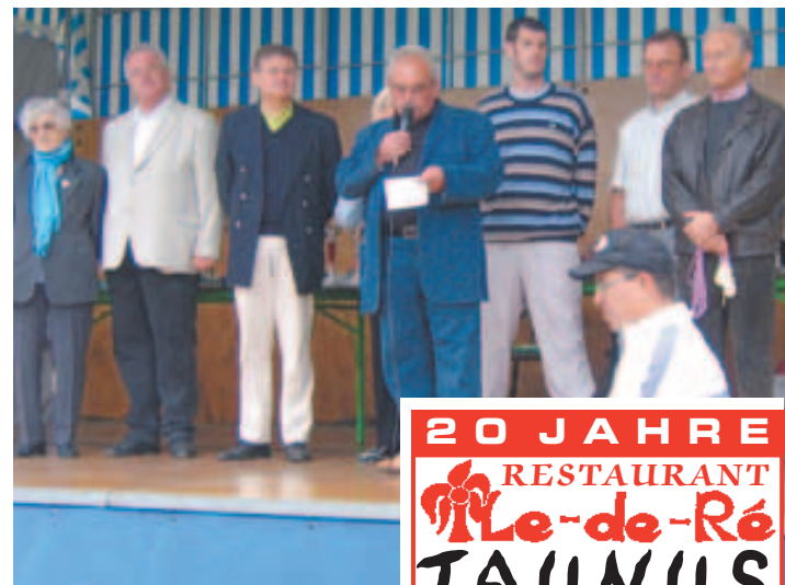
Begrüßung der Turniergäste durch die Turnierleitung aus St. Avertin