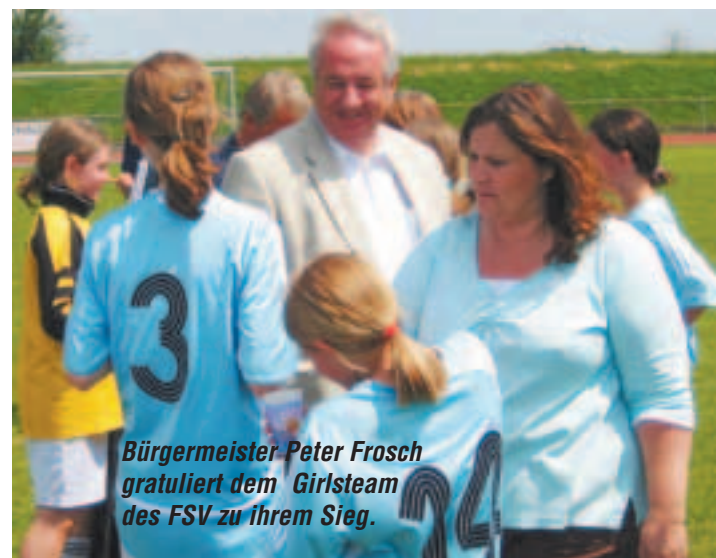
Bürgermeister Peter Frosch gratuliert dem Girlsteam des FSV zu ihrem Sieg.