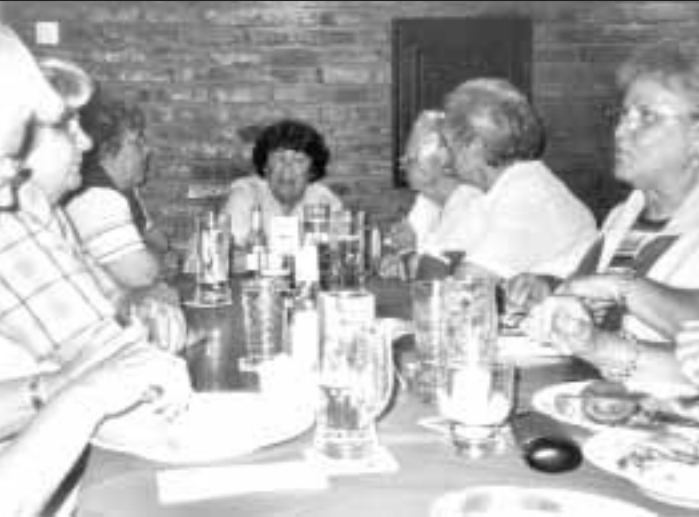
„die brücke“ Steinbach

Unser nächster Treff ist am 2. Aug. 2005 um 19.00 Uhr (gilt auch für Ella) in der Gaststätte „Zum Schwanen“. In alter Frische sehen wir uns, zum Babbeln, Essen und Trinken. Nun hört doch mal mit dem Wort zum Sonntag auf, wir wollen endlich anfangen zu essen. (Foto in der Gaststätte „Zur Linde“).