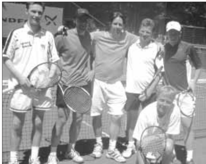
Herren 2 - eine tolle Truppe