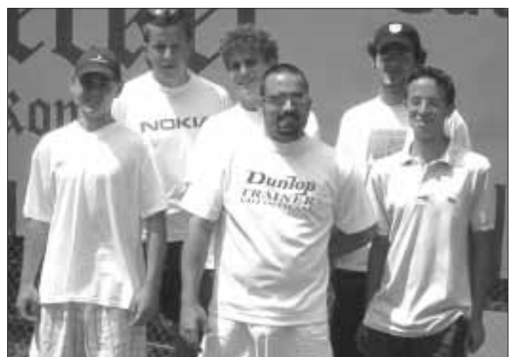
Herren 3 - die hoffnungsvolle Mischung.