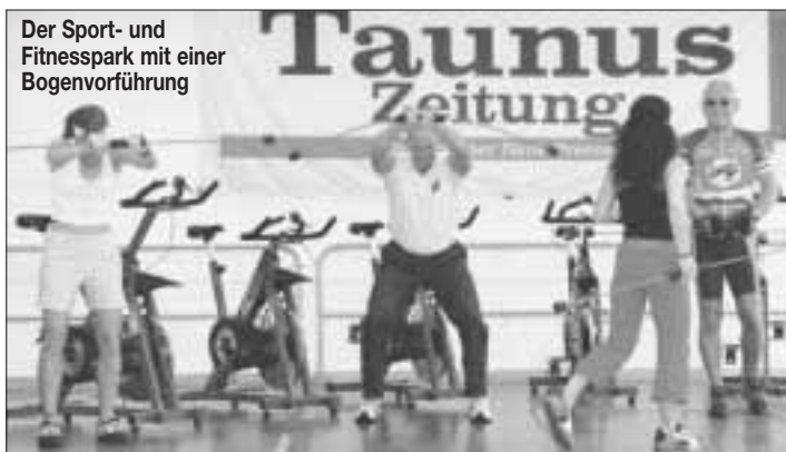
Der Sport- und Fitnesspark mit einer Bogenvorführung