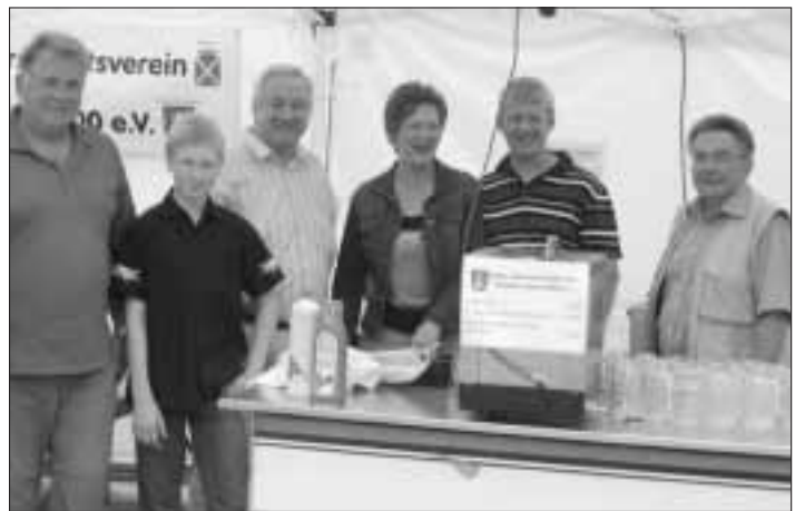
Evang. KITA „Regenbogen“ Steinbach