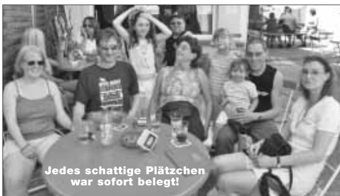
Jedes schattige Plätzchen war sofort belegt!