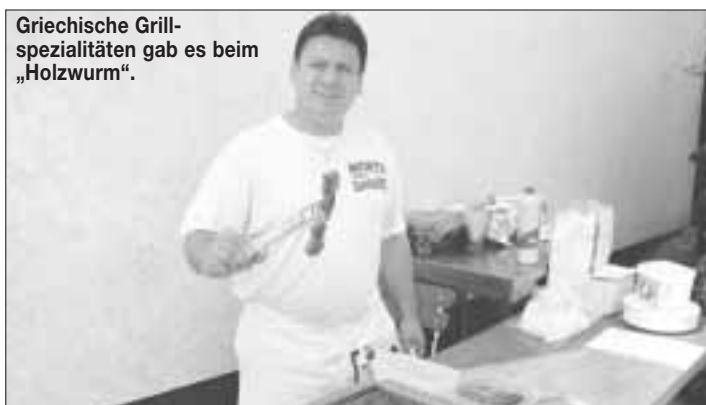
Griechische Grillspezialitäten gab es beim „Holzwurm“.