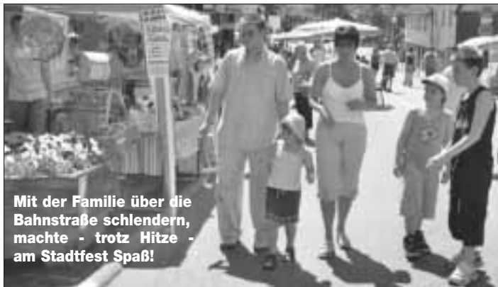
Mit der Familie über die Bahnstraße schlendern, machte - trotz Hitze - am Stadtfest Spaß!