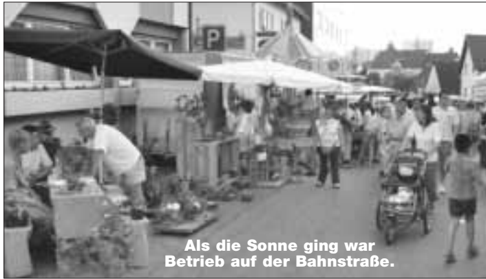
Als die Sonne ging war Betrieb auf der Bahnstraße.