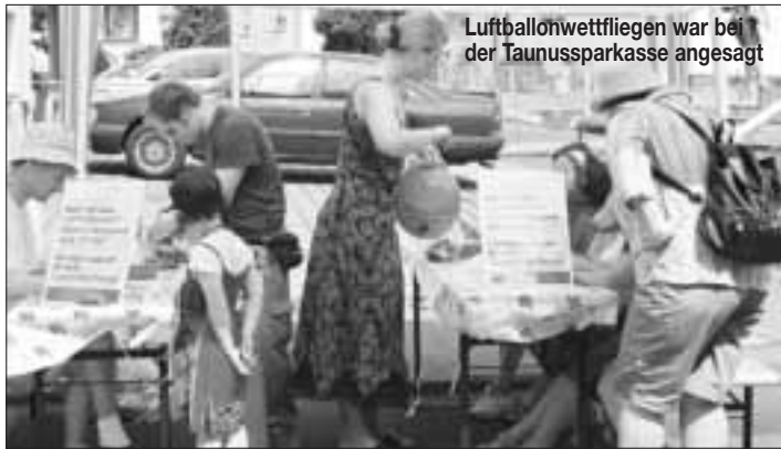
Luftballonwettfliegen war bei der Taunusparkasse angesagt