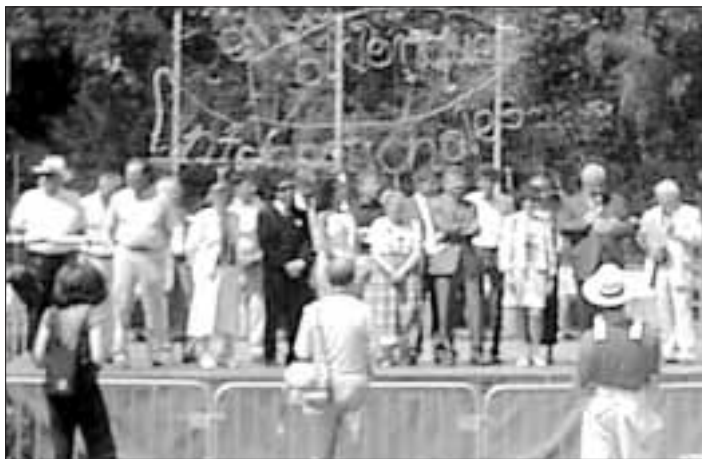
Stadt Steinbach - Amt für soziale Angelegenheiten -