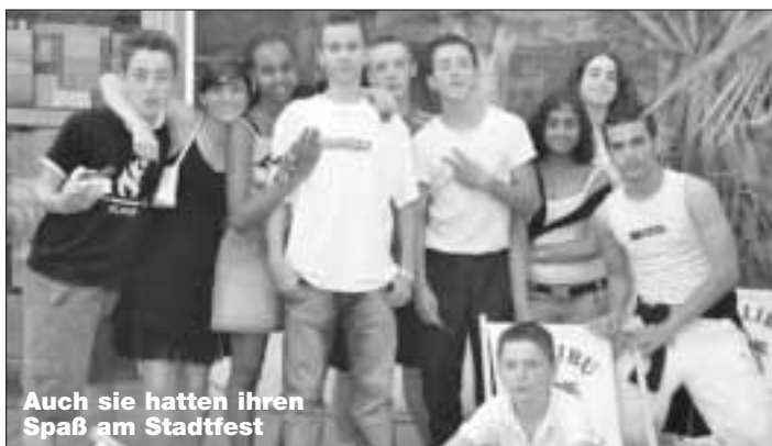
Auch sie hatten ihren Spaß am Stadtfest