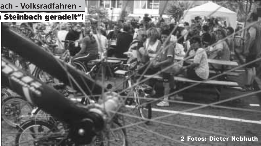
2 Fotos: Dieter Nebhuth

Diese haben Bürgermeister Peter Frosch, die Raiffeisenbank, Taunus-Sparkasse, die Firma Weru sowie das Ehepaar Schüler vom Restaurant Bürgerhaus gestiftet. Die TuS Steinbach konnte viele Mitglieder mobilisieren. Für den 1. Platz hat es aber leider nicht gereicht. Hier haben sich "die Nachbarn aus der Königsteiner Straße" stark hervorgetan. Sie