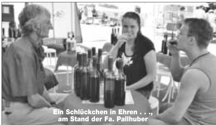
Ein Schlückchen in Ehren . . . am Stand der Fa. Pallhuber