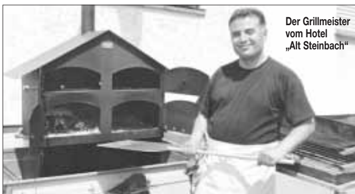
Der Grillmeister vom Hotel „Alt Steinbach“