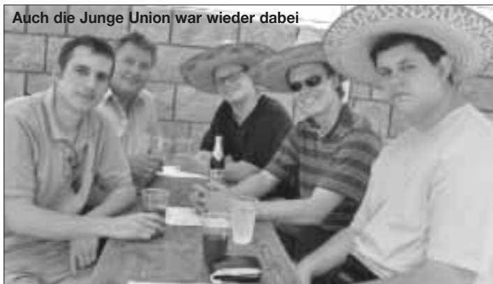
Auch die Junge Union war wieder dabei