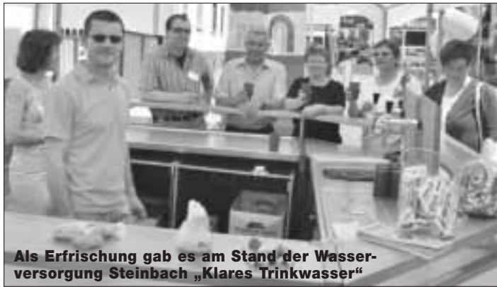
Als Erfrischung gab es am Stand der Wasserversorgung Steinbach „Klares Trinkwasser“