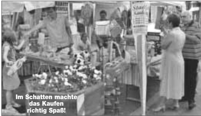
Im Schatten machte das Kaufen richtig Spaß!