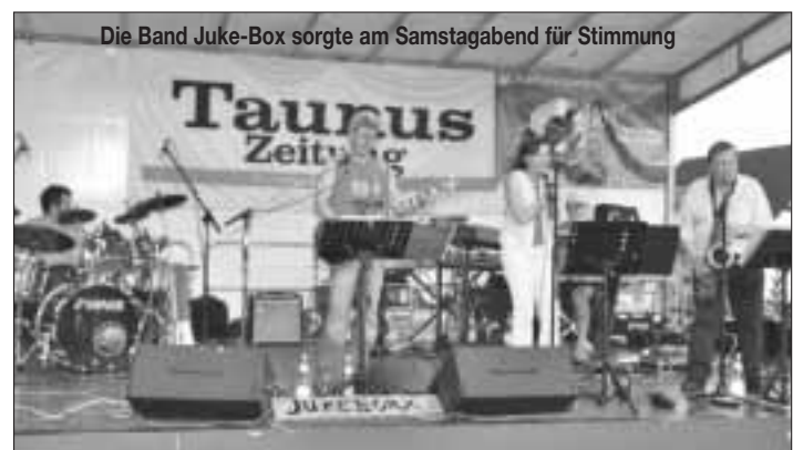
Die Band Juke-Box sorgte am Samstagabend für Stimmung