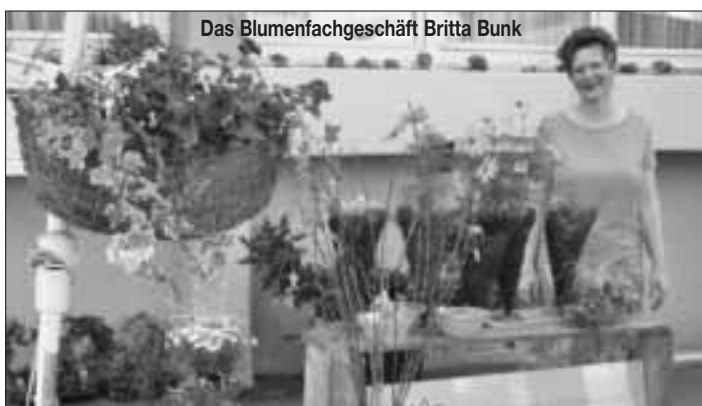
Das Blumenfachgeschäft Britta Bunk