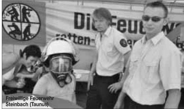
Freiwillige Feuerwehr Steinbach (Taunus)

stehung unseres Mittelgebirges zu berichten und zeigte zur Veranschaulichung einige Stücke Taunusquarzit und veranstaltete darüber hinaus noch ein Quiz, beim dem Stadtgeschichte gefragt war. Der Akkordeonverein spielte an beiden Tagen auf der Bühne und konnte somit allen Besuchern sein Können demonstrieren, aber auch am Stand zeigten die Mitglieder des Vereins, was sie vom Kuchenbacken verstehen. Mit einer großen Kuchentheke wurde für alle Gäste auch an das leibliche Wohl gedacht. Der Steinbacher Tennisclub baute auf der Strasse wieder ein Tennisfeld auf und jeder durfte mal probieren, wie man auf der Bahnstraße Tennis spielen kann. Die Kinder hatten viel Spaß und die Erwachsenen konnten bei gekühlten Getränken und Rindwurst dem Treiben zuschauen. Mit frisch geräucherter Forellen lockten die Fischer vom Angelsportverein Steinbach. Das Angebot umfasste Spezialitäten aus dem Fischbereich. In der nächsten Ausgabe werden wir über die weiteren beteiligten Vereine berichten. Jetzt schon geht unser Dank an alle beteiligten Vereine, welche zum Gelingen dieses großen Festes beigetragen haben und wir hoffen auch im nächsten Jahr wieder viele Vereine beim dann 3. Steinbacher Stadtfest begrüßen zu dürfen. Andreas Bunk