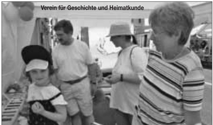
Verein für Geschichte und Heimatkunde