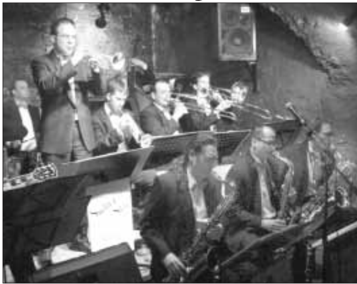
Aus dem Keller auf die Wasserbühne der IG BAU: Das Swing Size Orchestra

Im November des vergangenen Jahres reiste die Gießener Band Captain Overdrive nach Hamburg, um sich beim Wettbewerb "Deutscher Rock & Pop-Preis" der Jury zu stellen und trug in der Hauptkategorie Rock den Sieg davon. Zu diesem Zeitpunkt war bereits klar, dass Captain Overdrive beim 7. Steinbacher Kultursommer der Bildungsstätte Steinbach das erste von vier Konzerten bestreiten sollte. So freut man sich im Hause der IG Bauen-Agrar-Umwelt, den Steinbachern am Donnerstag, dem 23. Juni 2005 als „Opener“ eine junge, kreative - und jetzt auch ausgezeichnete - Nachwuchsband präsentieren zu können. Die vier Musiker bezeichnen ihre Musik selbst als "Power-Funk" und stechen vor allem durch ihre ungewöhnliche Zusammensetzung hervor: Gitarre - Bass - Schlagzeug - Posaune. Posaune? Genau! Captain Overdrive ersetzt die Position des Sängers durch einen Posaunisten, der nicht nur raumgreifend und effektiv das Bühnengeschehen beherrscht sondern mit seinem Instrument den Sound der Band unverwechselbar und zu etwas ganz eigenständigem macht. Captain Overdrive spielt präzise, unglaublich druckvoll und gleichzeitig sehr funky. Für den, der sich für neue, innovative Rockmusik interessiert, gibt es hier eine echte Entdeckung zu machen! Knapp eine Woche später - am Mittwoch, 29. Juni 2005 - wird