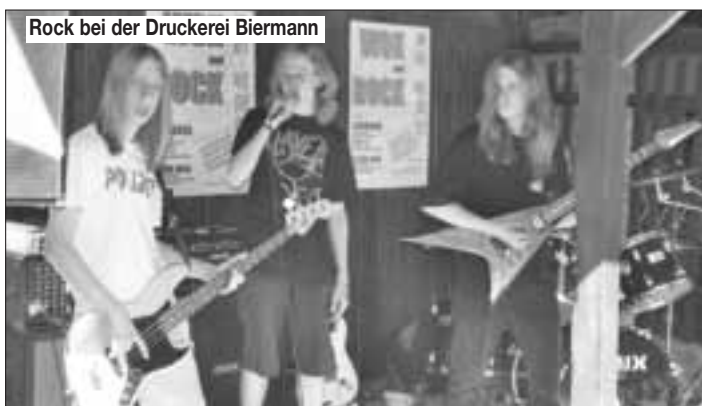
Rock bei der Druckerei Biermann