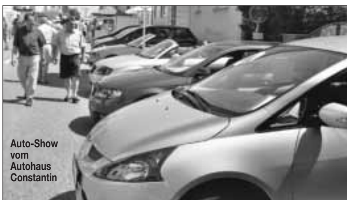
Auto-Show vom Autohaus Constantin