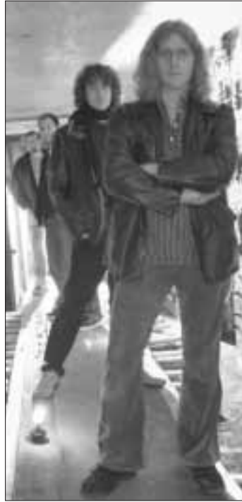
Gewinner des Deutschen Rockpreises: Captain Overdrive aus Gießen

Orchestra Salsaribe die Steinbacher bereits im letzten Jahr! Auf ausdrücklichen Wunsch wurde die elfköpfige Salsa-Band aus Frankfurt und Umgebung erneut eingeladen, um die Gäste des Steinbacher Kultursommers mit karibischen Rhythmen und ihrer ansteckenden guten Laune erneut auf die Beine zu bekommen. Ein Novum: Erstmals findet eines der Konzerte an einem Freitag, nämlich am 8. Juli 2005, statt um den Gästen, die sonst am nächsten Morgen früh raus müssten, einen unbeschwertem Musikgenuss und Tanzspaß zu ermöglichen, ohne dass sich am nächsten Morgen Reue einstellt.