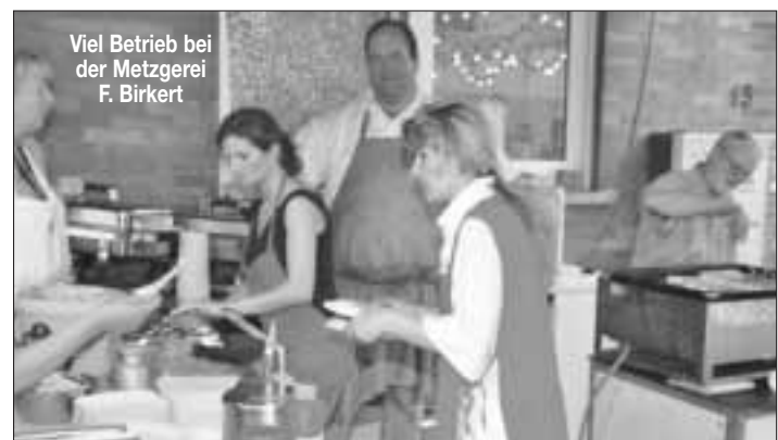
Viel Betrieb bei der Metzgerei F. Birkert