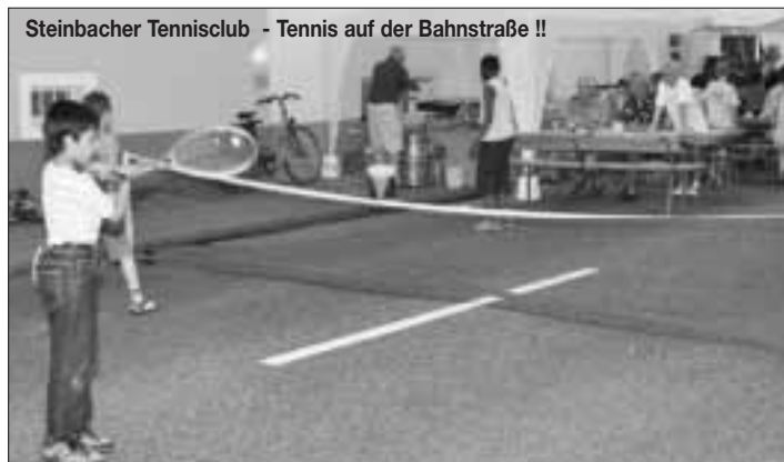
Steinbacher Tennisclub - Tennis auf der Bahnstraße !!