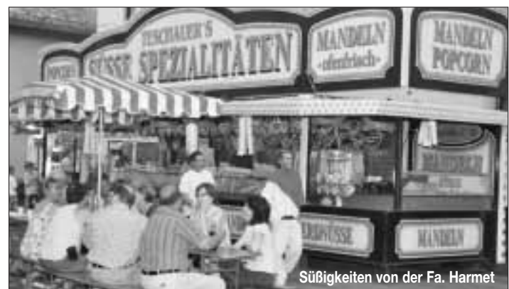
Stüßigkeiten von der Fa. Harmet