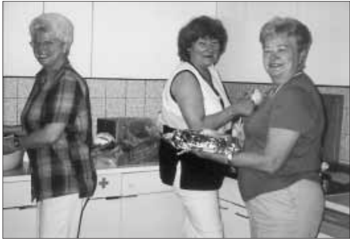
Unter Tränen lächeln, alles zum Wohl des Gastes.