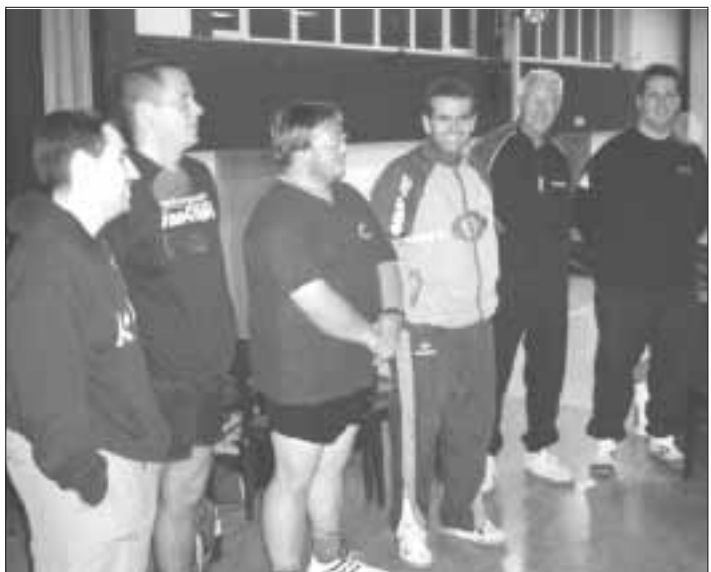
In der Kreisklasse des Hochtounuskreises spielt die 2. TT-Herrenmannschaft der TuS Steinbach.

Weihnachtsmarkt 2004 Am Weihnachtsmarkt - 4.+5.Dezember - wird der Jugendvorstand zusammen mit dem TuS Vorstand einen Stand betreiben. Verkauft werden Kakao, Kakao mit Schuss und zur kleinen Schlemmerei nebenher selbst gemachte Pralinen. Ebenfalls wird unsere Handballabteilung, wie in der Vergangenheit, mit einem Stand der Jugend und einem Stand der Erwachsenen vertreten sein. Reinhard P. Meisberger