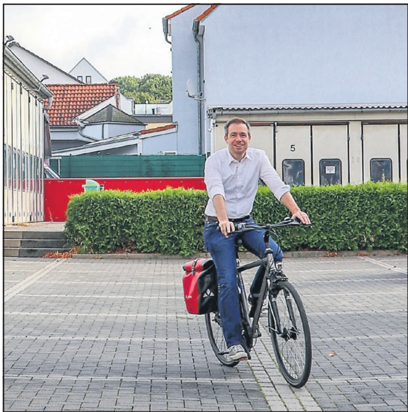
Bürgermeister Steffen Bonk auf dem Fahrrad