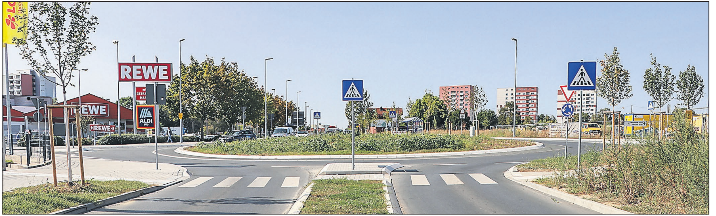
Der Europakreisel am Steinbacher Ortseingang bietet Fläche für eine Gestaltung. Die Steinbacher Stadtverwaltung hat zusammen mit einem Landschaftsarchitekten einen Entwurf zur Gestaltung erarbeitet und dieser Tage bei Hessen Mobil als Eigentümer des Kreisels eingereicht. Sobald eine Besprechung mit dem Straßen- und Verkehrsmanagement Hessen Mobil stattgefunden hat, wird die Stadtverwaltung über das weitere Vorgehen berichten.