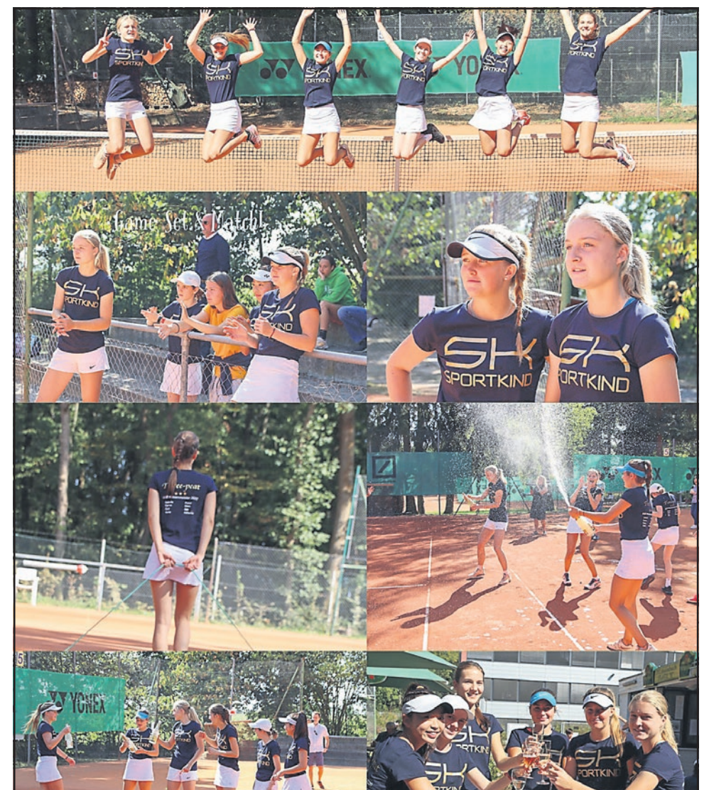
Also wieder ein Sommermärchen mit dem dritten Hessentitel in Folge, wie auch die Bilder wunderbar zeigen