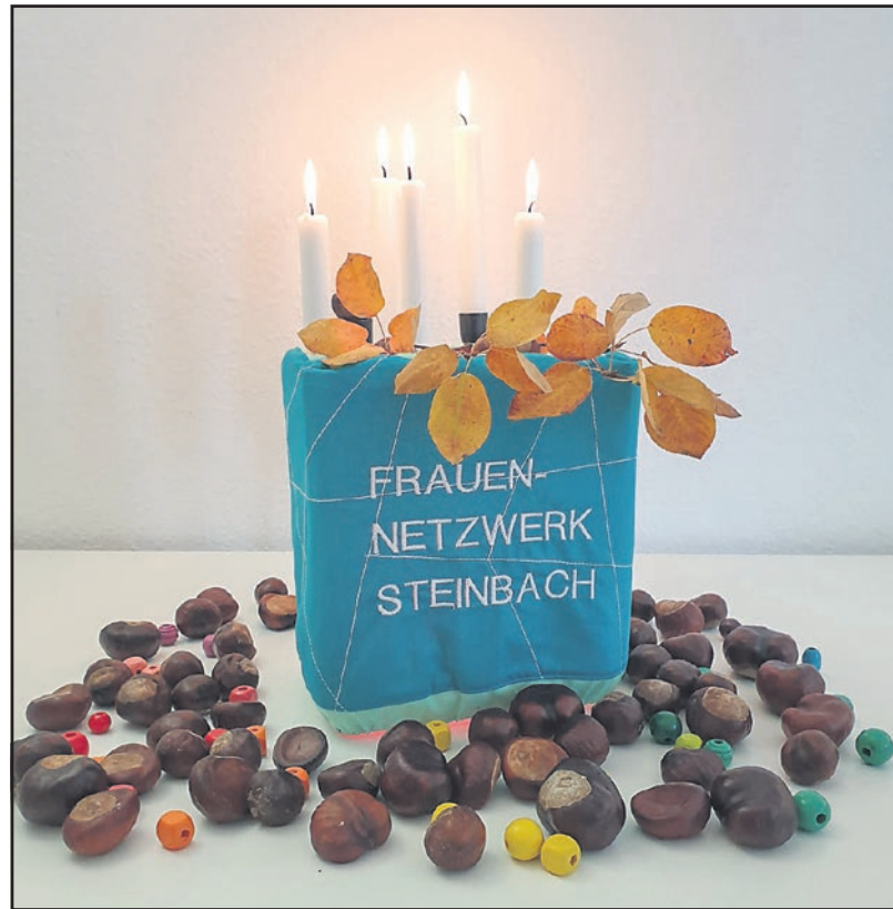
Wimpel und Foto: von Melanie Jell

Am 22.10.2015 wurde das Frauennetzwerk Steinbach gegründet. Aktuell sind 194 Frauen in der WhatsApp-Gruppe, mit regem Austausch über vielfältige Themen. Regelmäßig finden auch persönliche Treffen in der Steinbacher Gastronomie statt, aktuell pausieren wir.