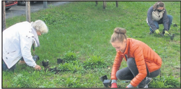
Schlüsselblumen für den Blumenrasen

Neue Mitglieder sind immer herzlich willkommen! Kontakt per E-Mail an steinbach-blueht@posteo.de.