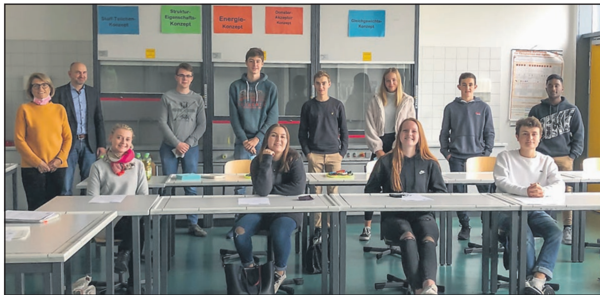
Zufriedene Pädagogen und elf glückliche Nachwuchslehrer bei der MiLeNa-Feierstunde

Um dem sich immer mehr abzeichnenden Lehrermangel in den Fächern Mathematik, Informatik und den Naturwissenschaften entgegenzuwirken, hat sich die Altkönigschule federführend zusammen mit der Goethe-Universität Frankfurt (Fachbereich Didaktik der Chemie) dafür eingesetzt, das Projekt „MINT-Lehrer-Nachwuchsförderung (MiLeNa)“ in Kooperation mit dem MINTeC-Verein in Hessen weiterzuführen.