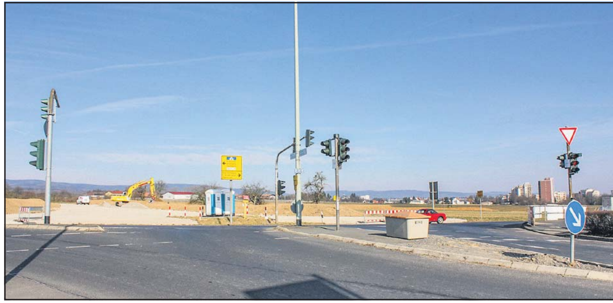
Gewerbegebiet „Im Gründchen“