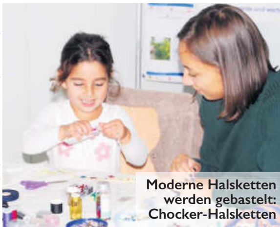
Moderne Halsketten werden gebastelt: Chocker-Halsketten

Eine zweite Aktion, in der sich Schönheit und Anmut spiegelten, war die Ausstellung von Kleidern, insbesondere von Brautkleidern, in verschiedenen Kulturen.