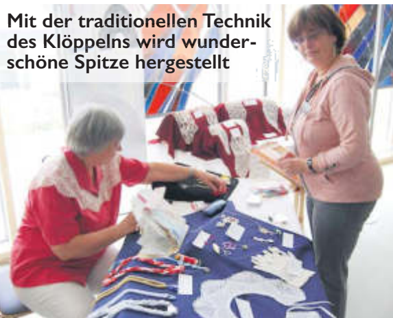
Mit der traditionellen Technik des Klöppelns wird wunderschöne Spitze hergestellt