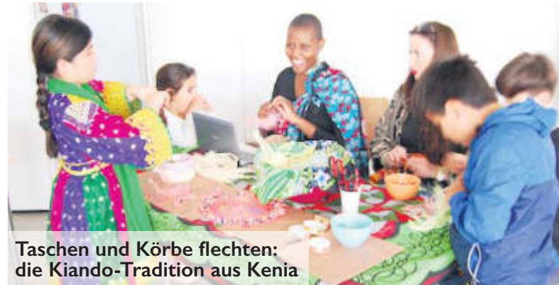
Taschen und Körbe flechten: die Kiando-Tradition aus Kenia

Schließlich konnten Frauen eigene Projekte ausrufen, für eigene Projekte werben: Frauen präsentierten Kiando flechten aus Kenia, andere führten in die ornamentale Körperbemalung mit Henna ein, eine Technik aus dem Nordwesten Indiens und Pakistans. Es wurde in die Technik des Klöppelns eingeführt und gezeigt, wie dadurch wunderschöne Spitzen entstehen. Als moderne Form des Schmucks wurde gezeigt, wie man Chocker herstellen kann. Und schließlich wurde die Schönheit der einheimischen Naturgärten auf Bildern ausgestellt – hoffentlich finden sich Menschen in Steinbach, die unsere Plätze verschönen.