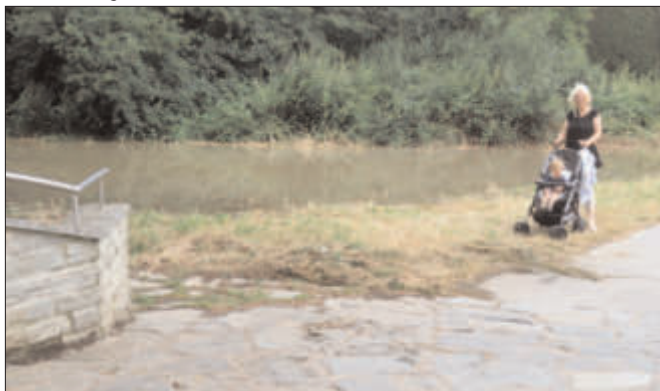
Bewundern Sie den "neuen" Weiher am Apfelweinbrückchen! Oder?