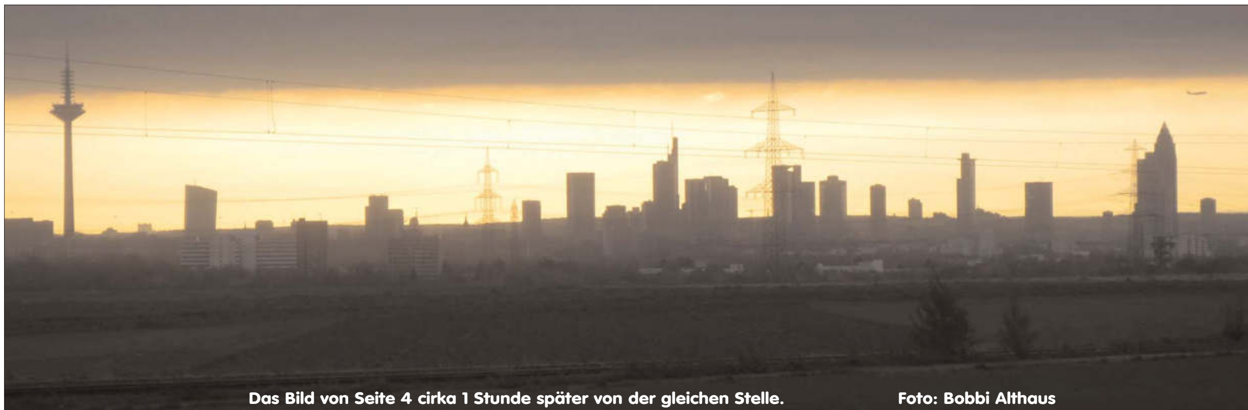
Das Bild von Seite 4 cirka 1 Stunde später von der gleichen Stelle.