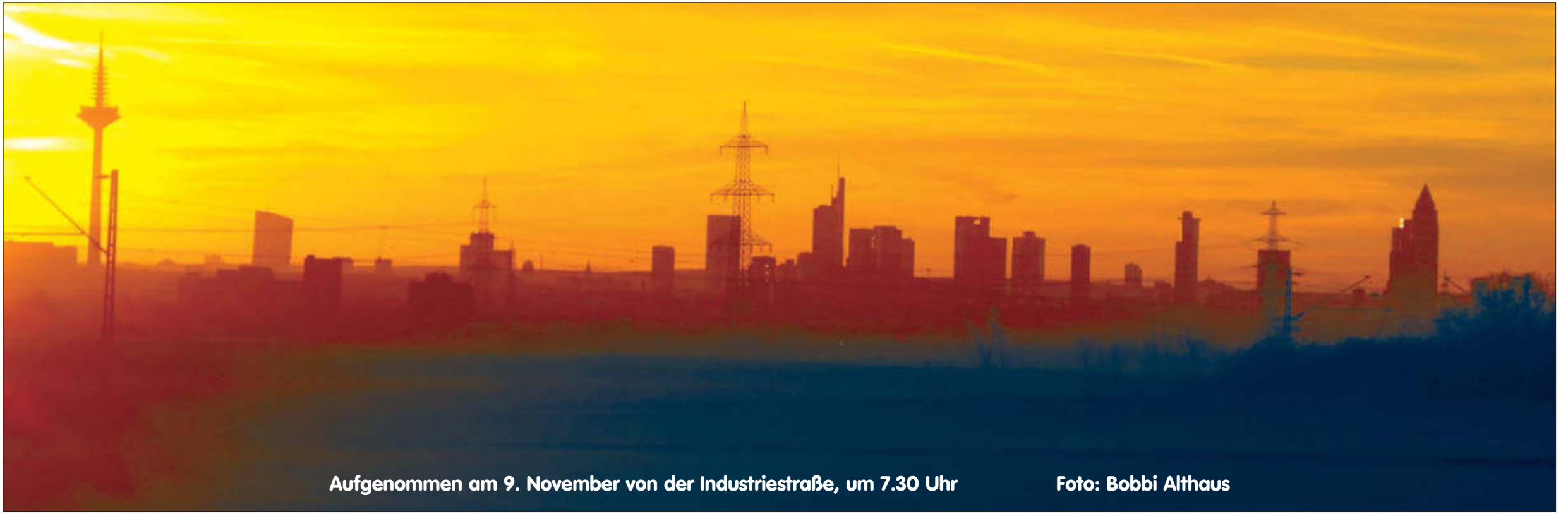
Aufgenommen am 9. November von der Industriestraße, um 7.30 Uhr