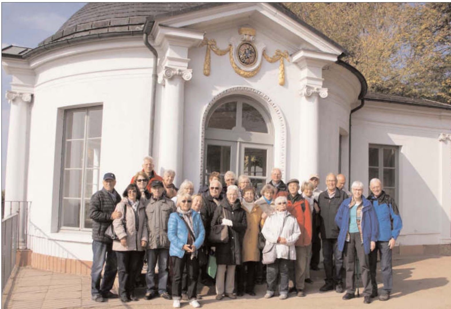
TuS Steinbach - Handball-Damen