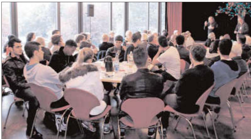
FSV Germania 08 Steinbach