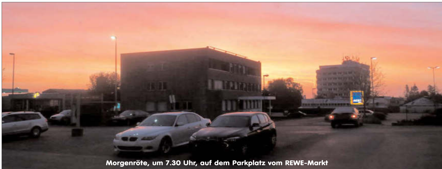
Morgenröte, um 7.30 Uhr, auf dem Parkplatz vom REWE-Markt