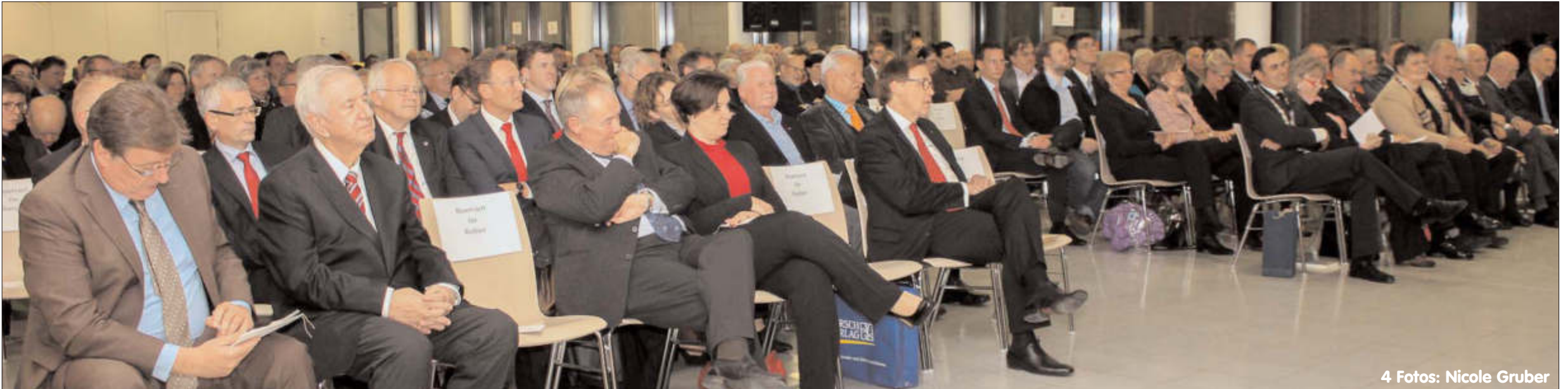
4 Fotos: Nicole Gruber

Liebe Bürgerinnen und Bürger Steinbachs, liebe Mitarbeiterinnen und Mitarbeiter der Steinbacher Verwaltung, verehrte Ehrengäste, Freunde, Unterstützer, liebe Frau Stadtverordnetenvorsteherin, meine sehr geehrten Damen und Herren, ich danke Ihnen allen für Ihr Kommen, die freundlichen Worte und Grußworte anlässlich meiner zweiten Amtszeit. Wie vor genau sechs Jahren ist mir etwas flau im Magen, man wird unsicher bei so viel Lob und guten Reden. Vor sechs Jahren war das genauso. Als ich damals in das neue Amt eingeführt wurde, wusste ich nicht, was auf mich zukommt. Politische Erfahrung hatte ich genug, aber in der Stellenausschreibung stand nicht, dass ich als