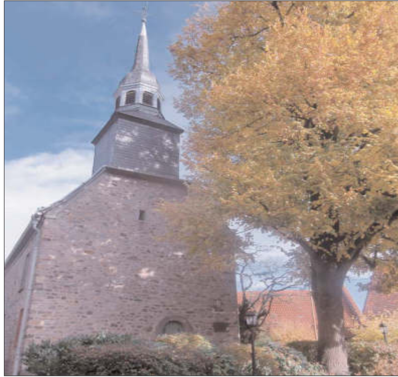
Evang. St. Georgsgemeinde Steinbach