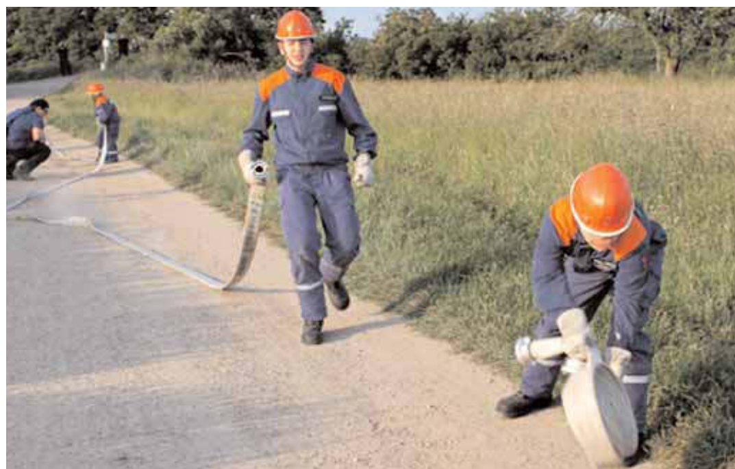
Freiw. Feuerwehr Steinbach