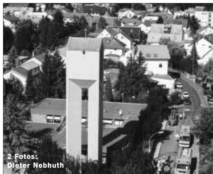
2 Fotos: Dieter Nebhuth

TuS Nieder-Eschbach II - FSG Steinbach/Sulzbach/Kronberg 15:29 Mit nur 10 Spielerinnen zeigte die FSG ein gutes Spiel, am Anfang lief es etwas holprig und wirkte zerfahren, aber dies war nur von kurzer Dauer (3:3 10. Min). Danach besannen sich die Damen der FSG auf ihre Stärken, kompakte Abwehr und überlegtes Angriffsspiel, und so legte man Tor um Tor zu. Über 10:5 und 14:6 zum 16:8-Halbzeitstand. Einziges kleines Manko war das teilweise schlechte Rückzugsverhalten. Nach der Pause machten die Damen gerade so weiter wie vor der Pause und damit wurde ein ungefährdeter Sieg nach Hause gefahren. Leider schlichen sich in der Schlussviertelstunde einige individuelle Fehler ein und so kam Nieder-Eschbach zu mehr Chancen, als es einem lieb ist. Aber die FSG hatte heute mit Torfrau A. Masuch über das komplette Spiel einen starken Rückhalt. "Nach einer so langen spielfreien Zeit war es klar, dass nicht alles auf Anhieb rund laufen konnte, aber das Team hat uns positiv überrascht." Am Ende der Saison wird das Trainergespann die FSG verlassen, einen Nachfolger gibt es noch nicht. "Wir wollen den greifbaren Aufstieg mit der Mannschaft natürlich noch vorher erreichen. Die Entscheidung fiel uns nicht leicht." Die Mannschaft: D. Fuchsberger 10/1, N. Diener 7/4, S. Gaalova 7, M. Beetz 2, M. Lotz, S. Setzer & M. Skiepkko je 1. Trainergespann M. Egersdörfer & J. Schulze