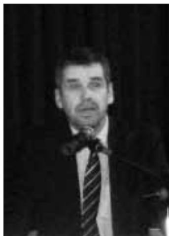
Holger Heil (CDU)