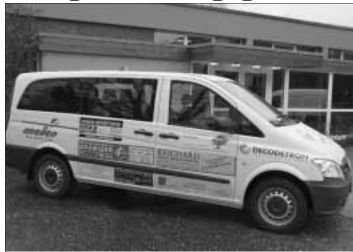
Die Evang. St. Georgsgemeinde Steinbach (Ts.) bedankt sich herzlich bei allen Sponsoren des neuen Gemeindebusses - ein Mercedes Vito

werden musste. Die Aktion startete im Frühsommer mit einem Anschreiben an alle Steinbacher Gewerbebetriebe, in dem sie auf das Vorhaben und die Gemeinnützigkeit hingewiesen wurden. Darauf folgten viele Gespräche und Telefonate mit den Betrieben. Anfang September konnten die Fahrzeuge bestellt werden. Zu diesem Zeitpunkt war klar: Die Arbeit hat sich gelohnt. Knapp zwei Monate später fuhren beide werksneuen Fahrzeuge zum „bekleben“ der individuellen Firmenwerbung vor. Es wurden die Werbeflächen der Sponsoren-Betriebe fachmännisch aufgebracht. Drei Wochen später waren sie fertig für die Übergabe, welche nun feierlich erfolgte. Es ist geplant, dass den Gewerbebetrieben als Dankeschön eine Urkunde mit einem Foto ihrer Werbefläche übergeben wird. So können sie stets ihre Gemeinnützigkeit bekunden.