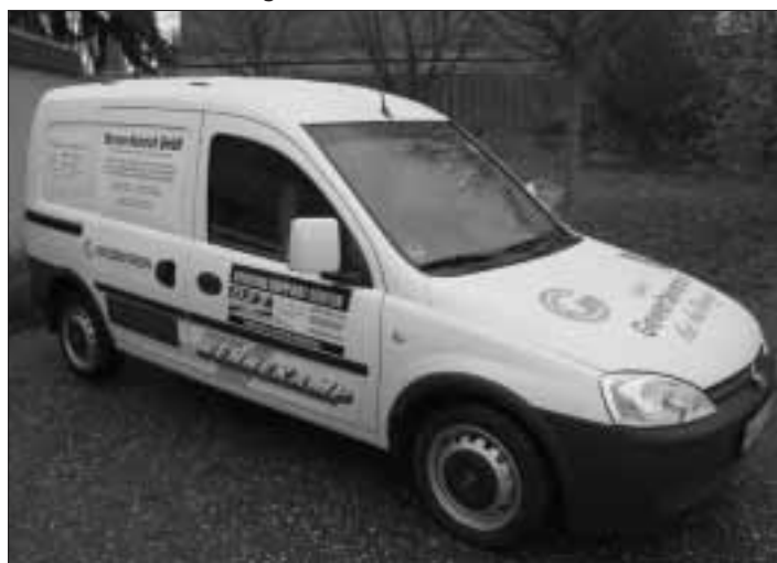
Die Stadtverwaltung Steinbach (Ts.) bedankt sich herzlich bei allen Sponsoren des neuen Sozialmobils - Opel Combo:

In Steinbach wird nicht nur gewohnt und geschlafen, sondern auch gelebt, gearbeitet, produziert, verkauft und gekauft. Das Gewerbe einer Stadt ist stadtprägend. Deshalb spielt das Steinbacher Gewerbe für das Leben in Steinbach eine Rolle, die es zu stärken gilt. Viele Gewerbetreibende sind auch Gemeindeglieder oder einer Christengemeinde zugetan. Deshalb wirbt die Ev. St. Georgsgemeinde gerne mit ihrem Gemeindebus für die Steinbacher Firmen, deren Werbung die Anschaffung des Busses erst möglich gemacht haben.