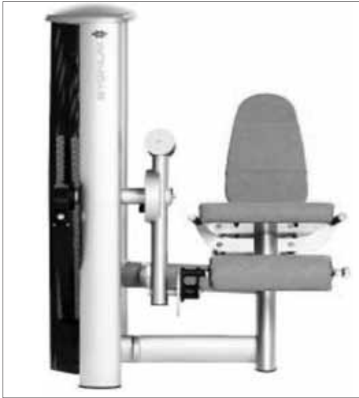
Das Gerät heißt Beinstrecker. Diese Maschine trainiert die Beinstreckmuskulatur.