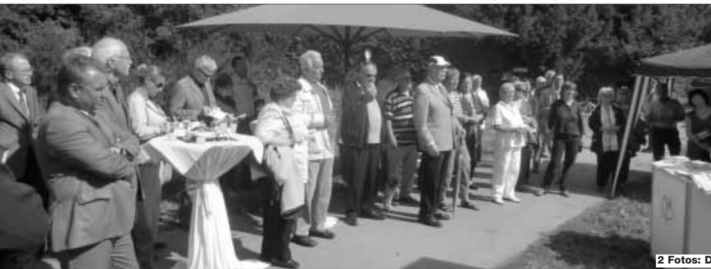
2 Fotos: Dieter Nebhuth