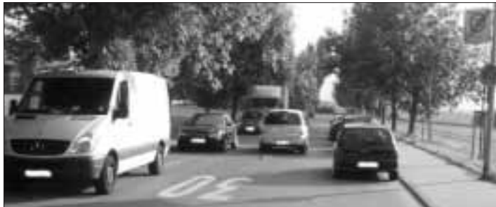
↑ Aller Anfang ist schwer . . . . aber 8 Tage später ↓