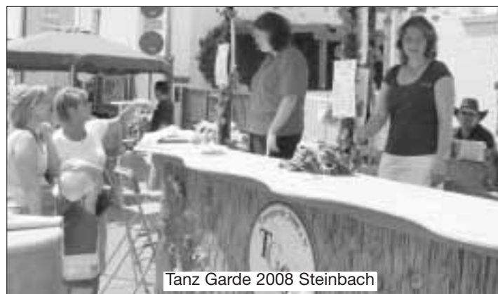
Tanz Garde 2008 Steinbach