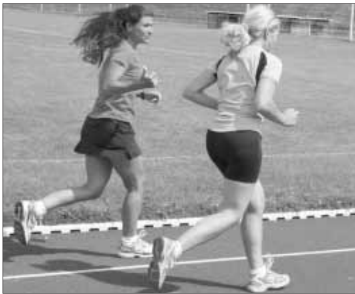
3 Fotos: Dieter Nebhuth