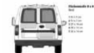
Insgesamt 18 Logoflächen Maßstab 1:20