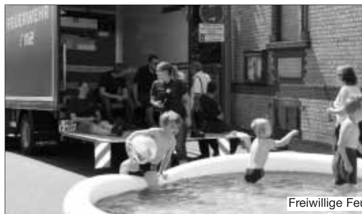
Freiwillige Feuerwehr Steinbach