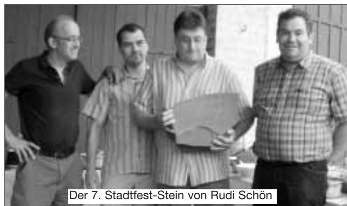
Der 7. Stadtfest-Stein von Rudi Schön