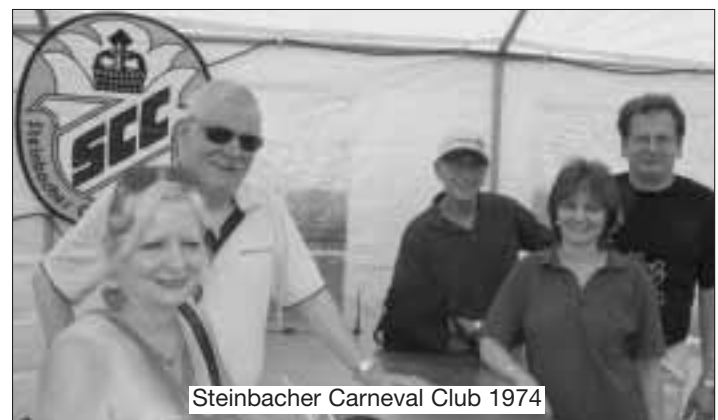
Steinbacher Carneval Club 1974