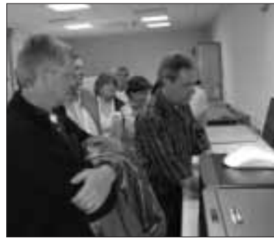
Dateneingang im PDF-Workflow

Text: Irmgard Althaus