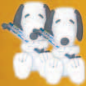
Intact Plüsch Snoopy mit Traubenzucker