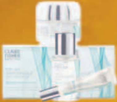
Claire Fisher Seidenkosmetik im Wert von € 100,00

Auf diese Preise können Sie sich freuen: