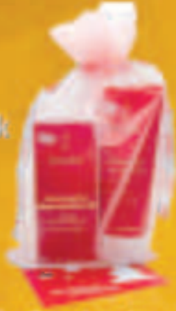
Welada Geschenkssets im Wert von jeweils € 21,95