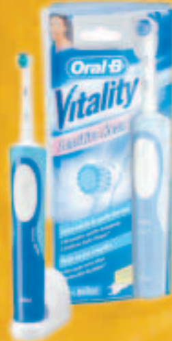
Oral B Vitality Zahnbürsten im Wert von jeweils € 24,95