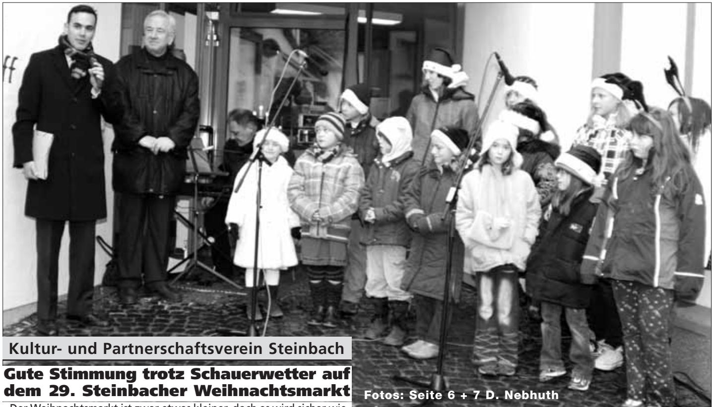
Kultur- und Partnerschaftsverein Steinbach

Tel. 0 61 71-72219 Eschborner Straße 21 61449 Steinbach (Taunus)