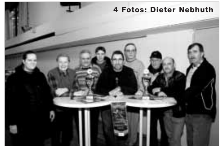
4 Fotos: Dieter Nebhuth

Fraktionschef Heino von Winning von der CDU bezeichnete den Schulbau als umweltfreundliche Gewerbeansiedlung. Und der Erlös von 2,4 Millionen Euro aus dem Grundstücksverkauf, inklusive der Abrisskosten eingerechnet, sei das Ergebnis geschickten Verhandlens. Viele Probleme, auch die schwache Ausnutzung der Sportanlagen, könnten somit gelöst werden, falls Steinbach den Zuschlag für den Schulbau bekäme. Dass es sich bei Phorms um eine Privatschule handele, damit könne seine Fraktion leben.