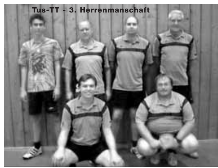
Tus-TT - 3. Herrenmannschaft