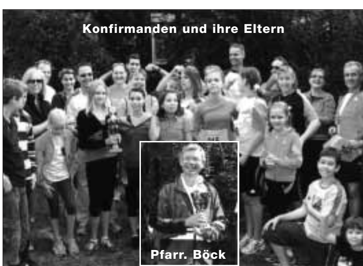
Konfirmanden und ihre Eltern