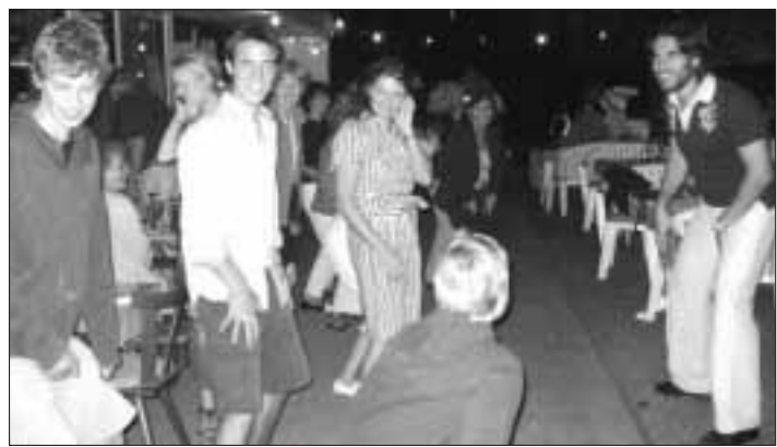
Empfang im Bürgerhaus - über 100 Besucher belegten alle Plätze