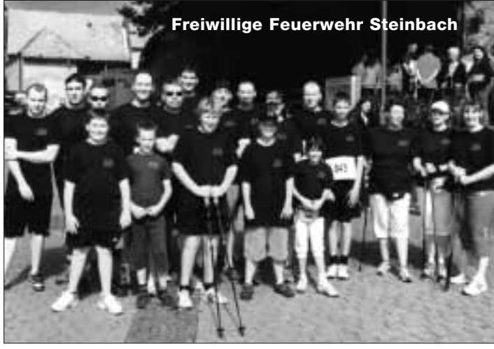
Freiwillige Feuerwehr Steinbach

Einen Pokal gab es für die stärkste teilnehmende Gruppe, hier lagen die Konfirmanden und ihre Eltern knapp vor den Mitgliedern der Steinbacher Freiwilligen Feuerwehr.