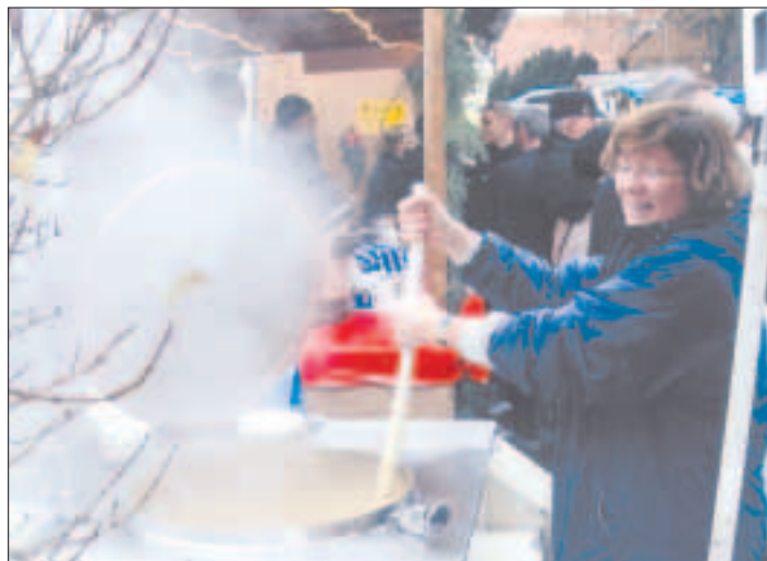
Die Erbsensuppe von der TuS...

Untergasse 13 · 61449 Steinbach (Taunus) Tel. (06171) ☎ 78232 - 72173, Fax (06171) 74840 E-Mail MSGartenland@AOL.Com www.gartengestaltung-schaefer.de.ms