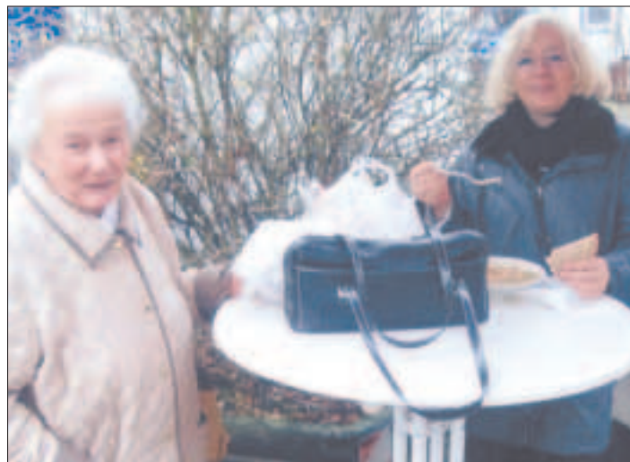
... die schmeckt immer!