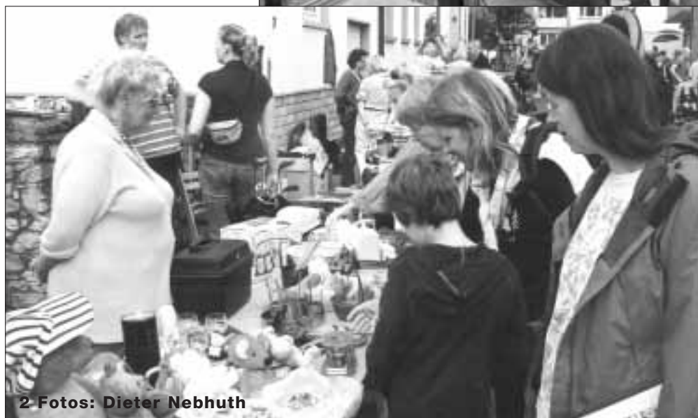
2 Fotos: Dieter Nebhuth

blumen ballenberger die Gärtnerei im Grünen Rautenberger Straße 73 60488 Frankfurt am Main Telefon: 069 / 97 65 12-0 Telefax: 069 / 97 65 12-44 http://www.ballenberger.de eMail: info@ballenberger.de