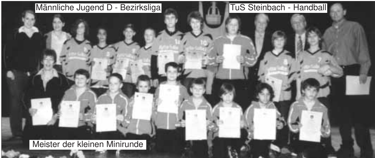
Männliche Jugend D - Bezirksliga