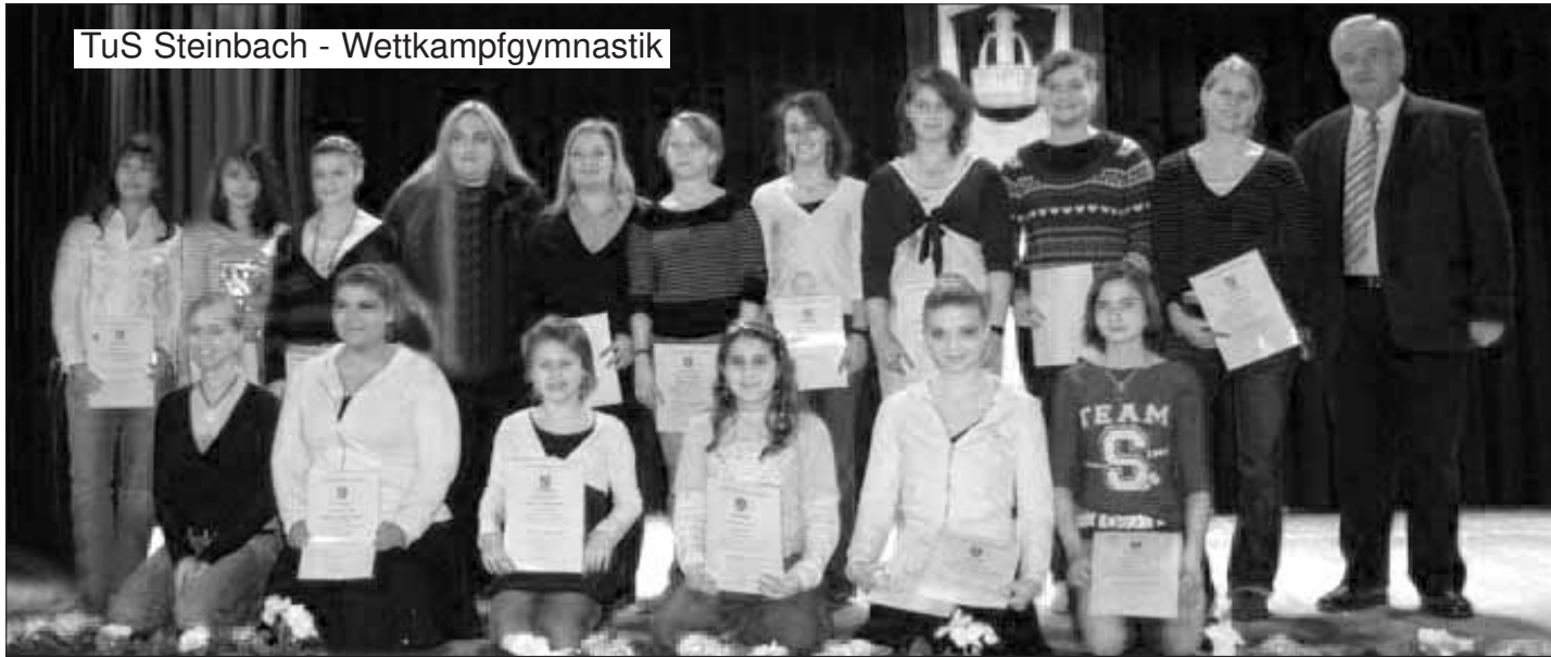
TuS Steinbach - Wettkampfgymnastik