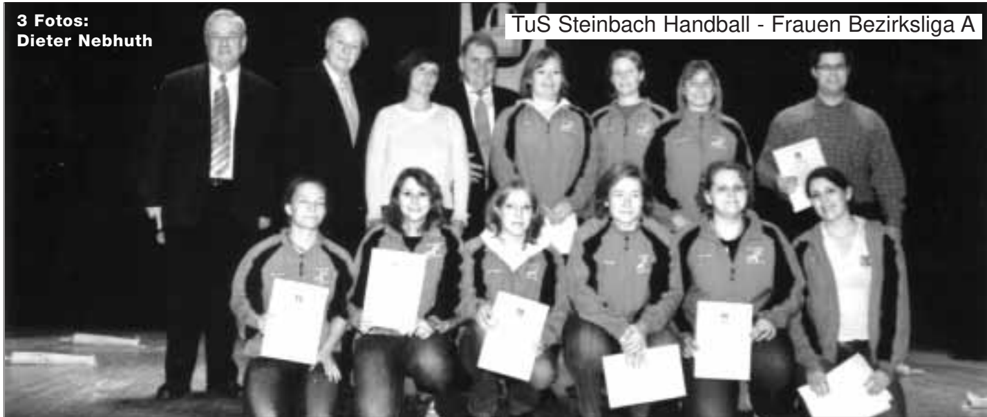
TuS Steinbach Handball - Frauen Bezirksliga A