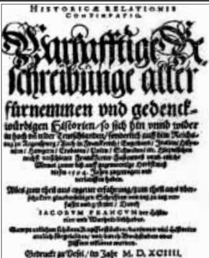
Letztes Blatt der Historischen Relation Frankfurter Fastenmesse, Herbst 1594 - Titelblatt