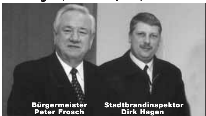
Bürgermeister Peter Frosch