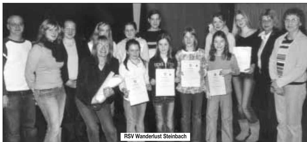
RSV Wanderlust Steinbach