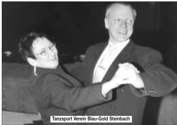
Tanzsport Verein Blau-Gold Steinbach

„HEUN'S-Getränkewelt“ 61449 Steinbach (Taunus) Industriestr. 17 - · 06171-71739