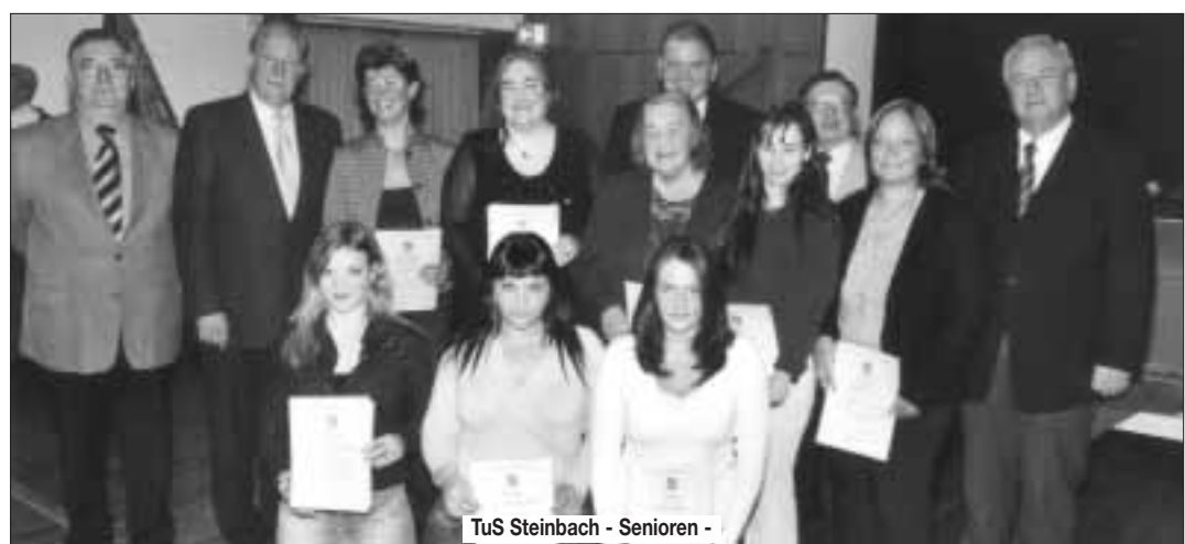
TuS Steinbach - Senioren