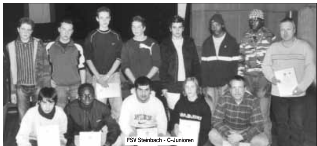
FSV Steinbach - C-Junioren