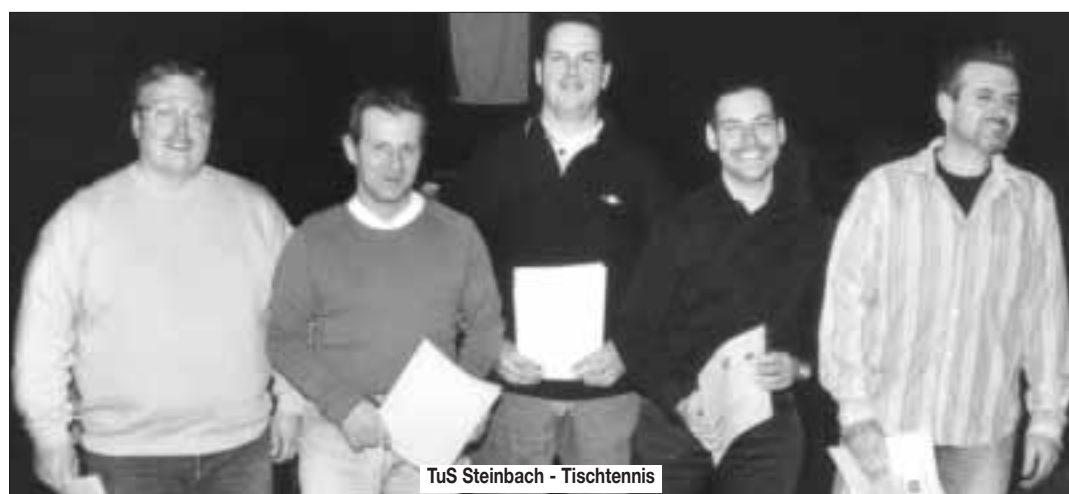
TuS Steinbach - Tischtennis