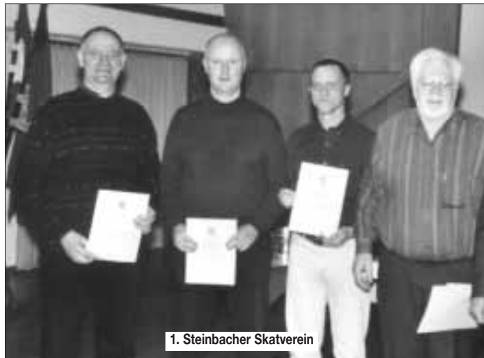
1. Steinbacher Skatverein