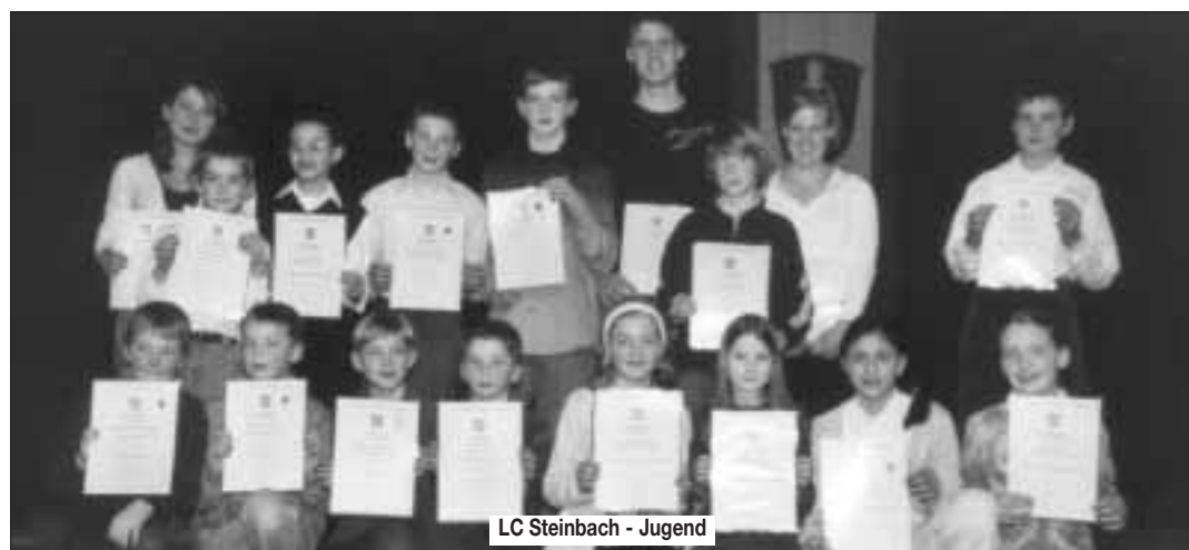
LC Steinbach - Jugend

STEMPEL BOBBI Bahnstraße 3 · Telefon: 981 983 Aktuelle Angebote: www.stempel-bobbi.de