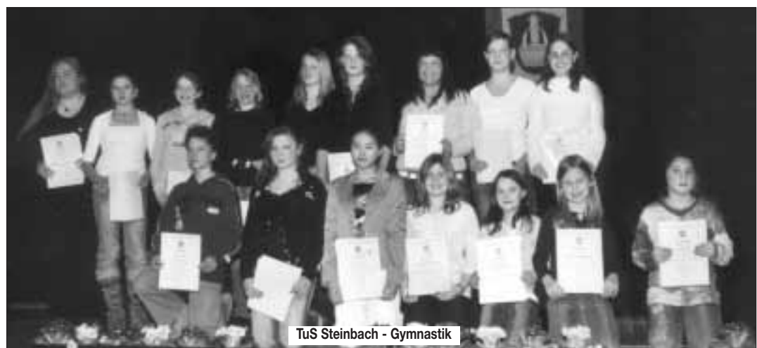
TuS Steinbach - Gymnastik