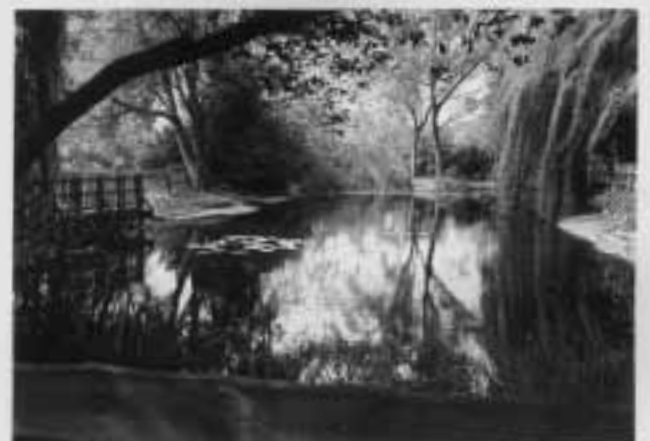
Der Steinbacher Fluß fließt durch das Steinbacher Tal.

STEMPEL BOBBI Bahnstraße 3 · Telefon: 981 983 Aktuelle Angebote: www.stempel-bobbi.de