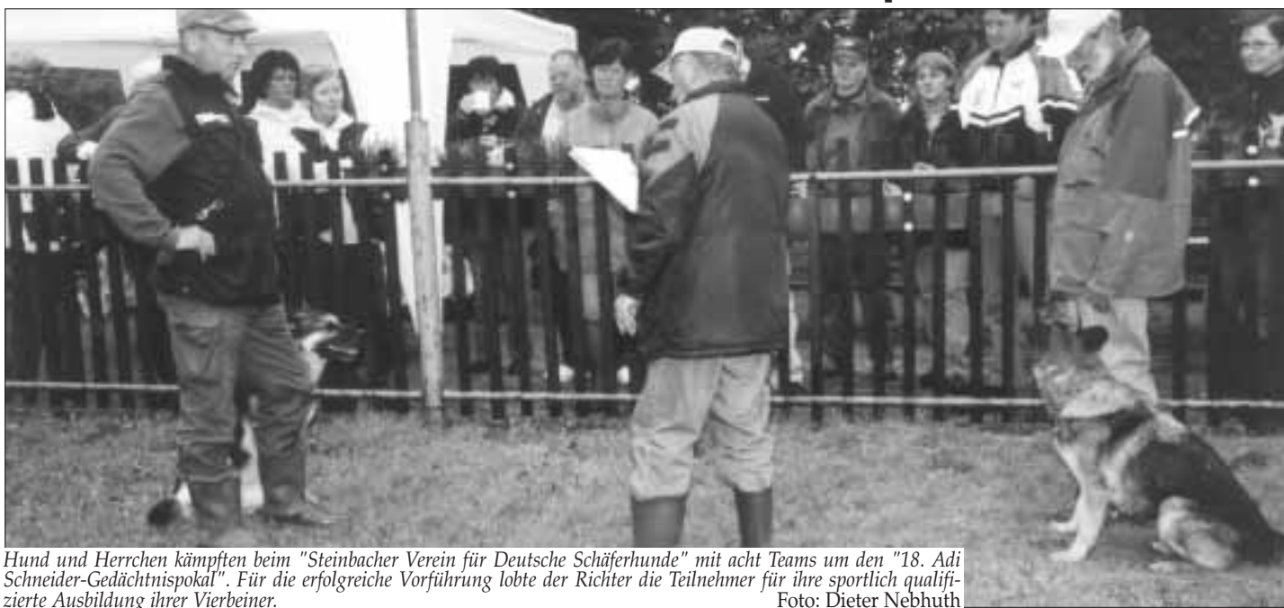
Hund und Herrchen kämpften beim "Steinbacher Verein für Deutsche Schäferhunde" mit acht Teams um den "18. Adi Schneider-Gedächtnispokal". Für die erfolgreiche Vorführung lobte der Richter die Teilnehmer für ihre sportlich qualifizierte Ausbildung ihrer Vierbeiner.